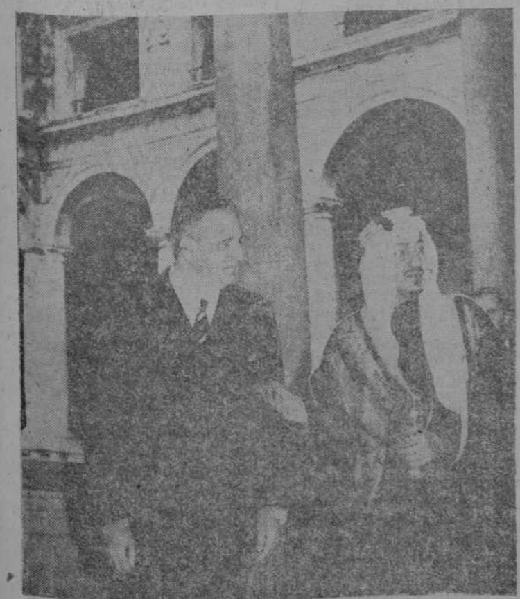
S. A. R. el príncipe Abdallah Al-Faisal, ministro del Interior y de Sanidad de la Arabia Saudí, durante su visita a nuestro ministro de Asuntos Exteriores, señor Martín Artajo, en el Palacio de Santa Cruz.