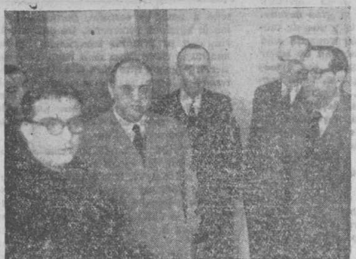
El excelentísimo señor gobernador civil, saludando a los presidentes de las Cámaras Oficiales Agrarias, en la C. N. S. de Salamanca