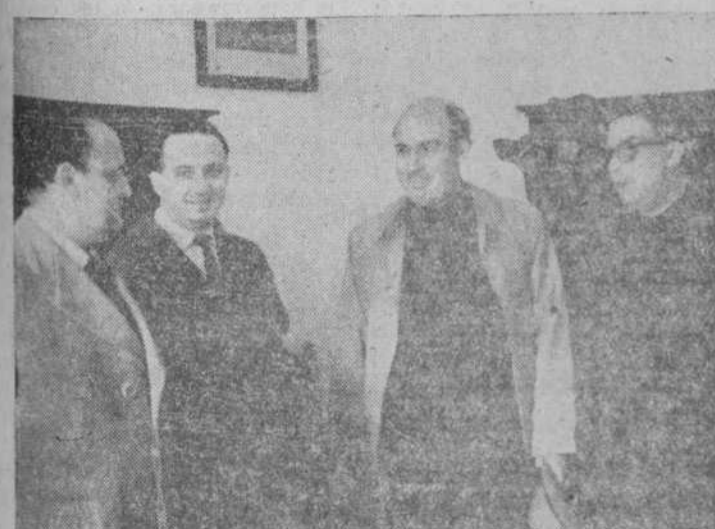
El jefe provincial del Movimiento, tras la toma de posesión del nuevo vicesecretario provincial de Obras Sindicales...