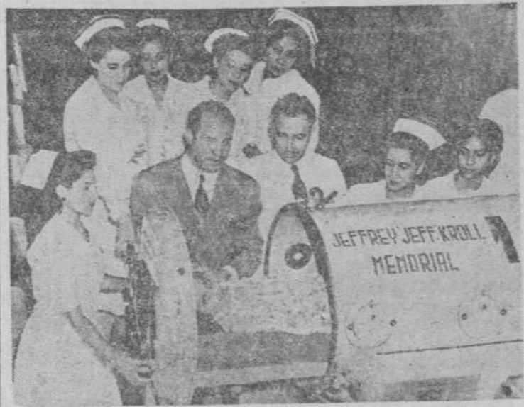
Un pulmón de acero, regalado a Méjico por un particular norteamericano...

Es sabido que el arma más eficaz contra la poliomielitis son los "pulmones de acero".