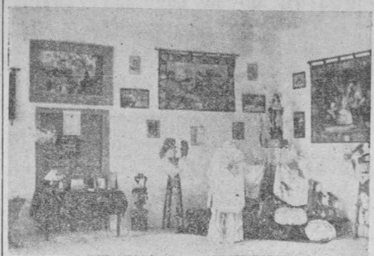
Un rincón de la Exposición de trabajos del Colegio de Siervas de San José

Como complemento de la clausura del curso, que tuvo lugar solemnemente el pasado día 14, las RR. MM. Siervas de San José, inauguraron en su Colegio de Marqués de Almarza, una interesantísima Exposición de los trabajos realizados por las alumnas durante la temporada escolar.