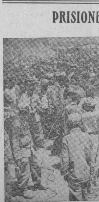
Un campo de concentración de prisioneros en Pusan (Corea)

Manifiestaciones del arte antiguo en Madrid. Le contestó el patriarca, quien dió las gracias al Estado y al ministro por esta empresa que la diócesis no hubiera podido llevar a cabo por sí sola. El doctor Eijo y Garay terminó su discurso con grandes elogios para la obra gigantesca que Franco y su Gobierno han realizado en la reconstrucción de España. Seguidamente el patriarca, revestido de pontifical, procedió a la bendición del templo, y acompañado del ministro y autoridades recorrió las dependencias del mismo.