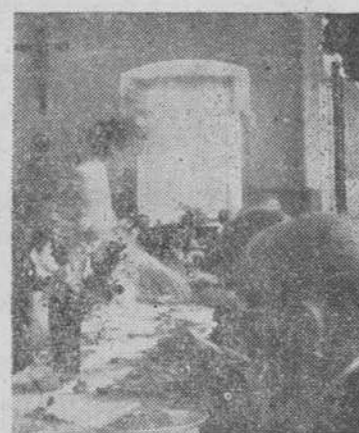
La esposa del gobernador civil sirviendo la comida a los ancianos.

bellas presidentas y caballistas, a los toreros, que han demostrado, una vez más, su generosidad y su bondad de sentimientos, y a sus compañeros de la Comisión organizadora. Las palabras—emo-