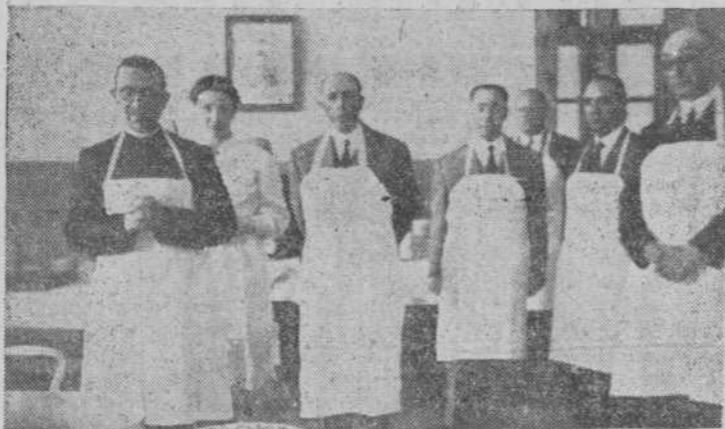
El capellán del asilo rezando las acostumbradas oraciones antes de la comida. En segundo término, la esposa del excelentísimo señor gobernador civil con algunos de los componentes de la comisión organizadora del festival.

Sirvieron las mesas la esposa del gobernador, distinguidas señoritas y miembros de la Comisión organizadora del festival