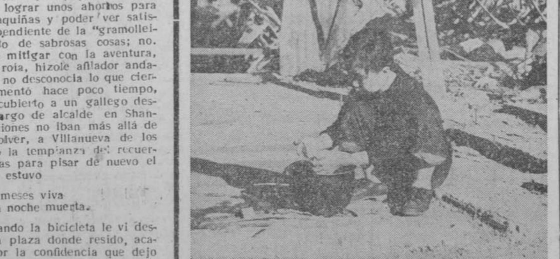
En plenas ruinas de la capital coreana de Seul, esta niña lava su muñeca utilizando el casco de un soldado norteamericano