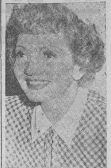
Naturalmente que no ha habido nadie que se haya equivocado en la identificación de la artista, cuya foto nos envió para nuestro concurso el amigo del jueves. Es trata de CLAUDETTE COLBERT, protagonista de la emo-