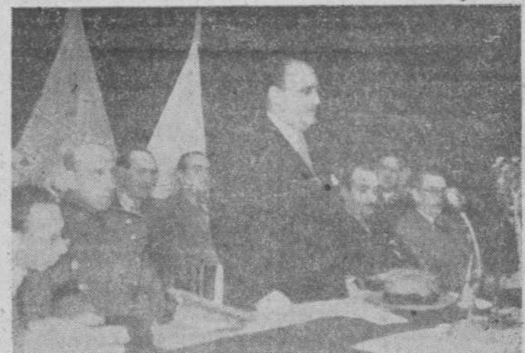
El gobernador civil pronunciando su discurso de clausura del Congreso