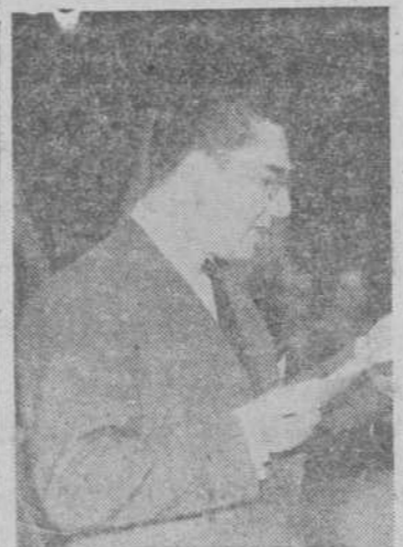
El secretario del Congreso da lectura a las conclusiones definitivas

El interés despertado por las sesiones de trabajo y los planes del Congreso Sindical Agrario de Castilla la Vieja y León, culminó en la mañana de ayer, en el solemne acto de clausura de esta asamblea, que durante cuatro días ha tenido lugar en nuestra ciudad.