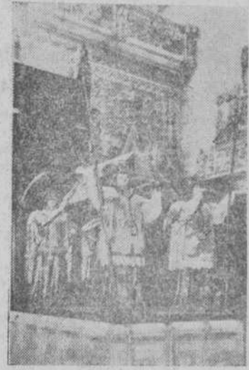
Sepulchro de Colón

Y además de todo eso, ¡LA FERIA!, que es también el arte en la calle; el arte popular —folklore puro—, y la alegría y el garbo de aquella tierra encantadora. Serán siete días maravillosos los que disfruten en Sevilla el concursante agraciado y su acompañante. Y todo ello gracias a las colaboraciones que nos prestan SEDERÍAS RIDRUEJO —en posesión de las más variadas colecciones de telas para vestidos de primavera y verano, así como de lanas para los elegantes trajes de chaqueta—; PERFUMERÍAS, DROGUERÍAS Y FARMACIAS RECIO —siempre al mejor servicio de la belleza femenina con sus exclusivas de los productos "Ana Bolena" y "Margaret Rosse"—, y "LA UNIVERSAL", S. L., oficina creadora y distribuidora de