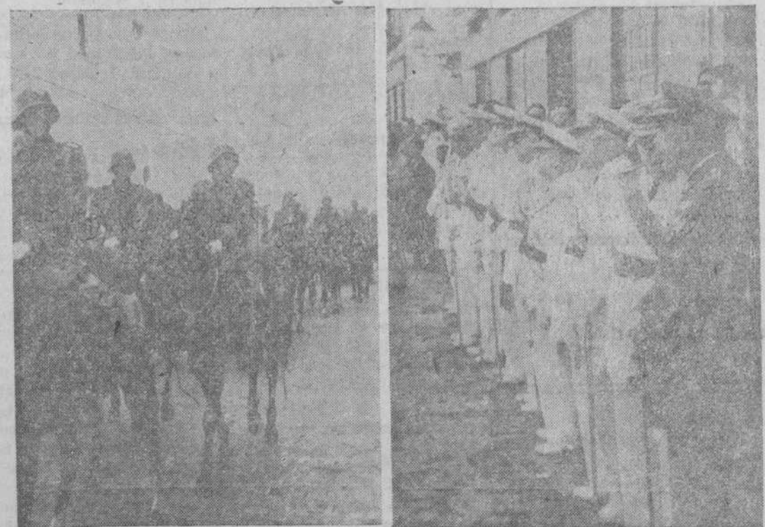
Con motivo de la festividad de Santiago Apóstol, las fuerzas de Caballería desfilaron, en Madrid, ante el jefe del Estado Mayor, general Barrón, y otros generales, a la salida de la solemne función religiosa celebrada en el templo de las Comendadoras de Santiago.