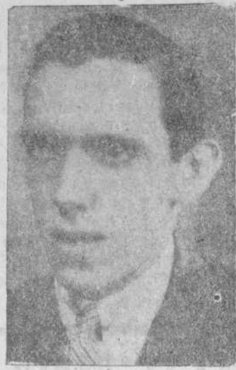
Salamanca por la buena acogida que tanto el público como vosotros, la Prensa, me habéis dispensado.

—¿Dónde radica el éxito de una opereta? —El éxito radica en el libreto —contesta Bernalt. —¿Y la perpetuidad en la música —añade Enrique. —¿Y cuáles son las condiciones que debe reunir un buen libreto? —Indiscutiblemente, para conseguir un buen libreto, hemos de dar gracia a las situaciones. El libreto precisa más de equívocos, de situaciones cómicas, que de chistes, de "gans" y también ha de tenerse la habilidad y los conocimientos necesarios para dar entrada a los números musicales... —Y te falta añadir —interviene Bernalt— que el diálogo sea limpio y jugoso. —Así, pues, se despidió que los laureles los da el libreto y el dinero la música, ¿no es así? —Exactamente —contestan los dos a un tiempo. —¿Estás contento con tu libreto "En la corte del Gran Visir"? —Estaba contento con el original. —¿Qué quieres decir? —La opereta que ayer presentamos no es la verdadera. La verdadera la estrenamos en Valladolid, pero tuvimos la de gracia de que nos fracasó el galán y me vi obligado en una noche a cambiar toda la obra. Es decir, para concretar: El papel que representa la "vedette" que hace de periodista, correspondía al galán y ello trae consigo que muchas de las escenas no se presentan con la claridad que el libreto primitivo poseía. Esta es la espina que tengo clavada y que hace esté en deuda con