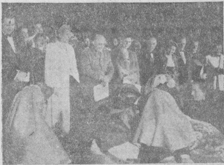
En 1947, doña Eva Duarte de Perón realizó un viaje a España. He aquí a la esposa del presidente argentino con Su Excelencia el Jefe del Estado, Generalísimo Franco, durante la fiesta celebrada en su honor, en la Plaza Mayor madrileña, y en la que se le hizo entrega de un traje regional de cada provincia española.

Doña Eva Duarte ha sido una destacadísima figura en la vida de su país. Según las palabras de un corresponsal ex-