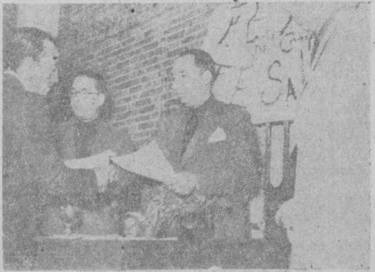
Los huertanos de Campo de Peñaranda, recogiendo sus títulos de manos del excelentísimo señor gobernador civil