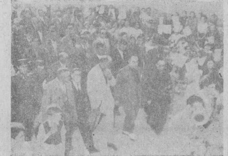
Llegada de las autoridades y jerarquías a Babilafuente

Comerciantes, Industriales ¿Tiene créditos morosos? Abusos e MUTUA COMERCIAL ESPAÑOLA, que se les librará seguidamente. ENL. FRANCO, 34, 1.º SALAMANCA