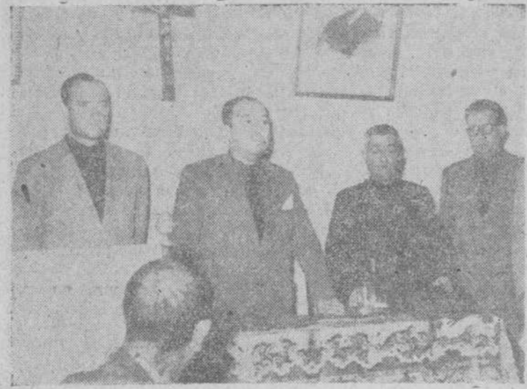
El excelentísimo señor gobernador civil durante el discurso pronunciado en Zorita