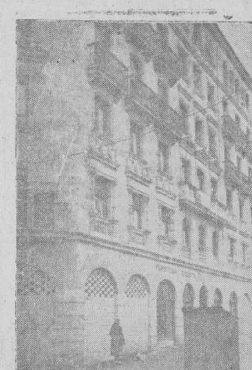
Edificio levantado también acogido a los beneficios concedidos por el Estado, en la calle del Generalísimo, esquina a Vázquez Coronado

Hace muchos años, que, por expertos, conocedores o previosores del asunto, se aconsejaba a los Ayuntamientos, la conveniencia de expropiar esos terrenos de cultivo, e incluso el término municipal si conviniere, no solamente para regular el valor del suelo y evitar tales especulaciones, sino también y principalmente, para orientar y dirigir la edificación hacia las zonas que,