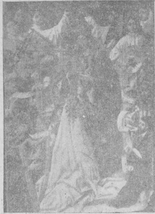
Tabla de La Coronación de la Virgen, de Fernando Gallegos

Nuevamente volvemos sobre el tema de la recuperación de nuestra riqueza artística, que de hace poco tiempo a esta parte ha alcanzado tanta importancia, como para pensar en un museo de primer orden, sobre todo de valores góticos como en pocos lugares pueden reunirse.