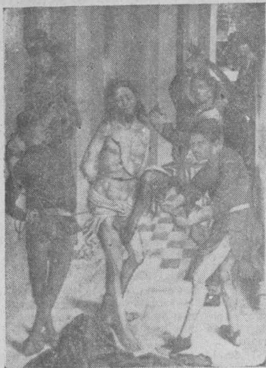
Tabla de Fernando Gallegos, representando La Flagelación

Extensa labor artística de la Diputación Provincial bajo la presidencia del señor Gutiérrez de Ceballos