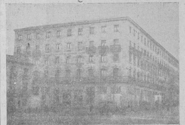
Moderno edificio construido en la Plaza de San Julián y Gran Vía, acogido a los beneficios estatales

Todos sabemos, que los solares han adquirido un valor desorbitado, y, para el cual no es posible encontrar justificación. Los mejores negocios de