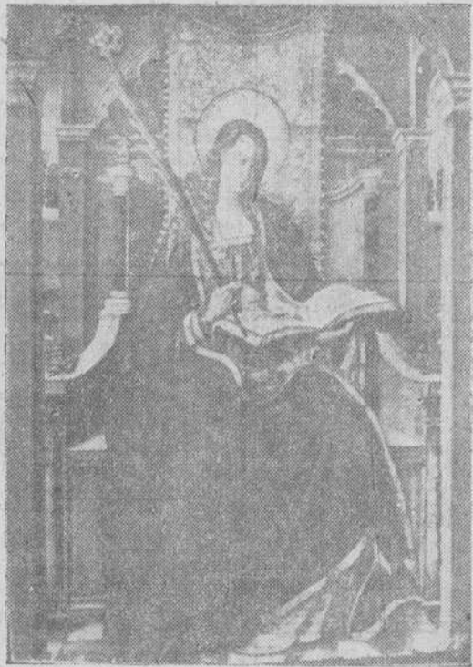
Tabla de Santa Catalina, magnífica obra del siglo XV