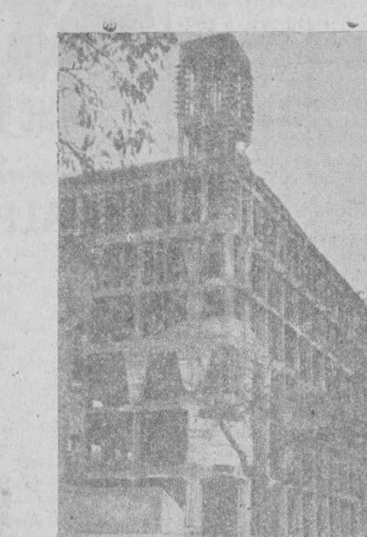
Esqueleto del gran edificio en construcción, haciendo esquina a las calles de Zamora y Calvo Sotelo

en cada momento, más conviniere a la ciudad. De esto, que nosotros sepamos, nada se hizo. Esperamos a que la ley del suelo que se prepara resuelva este problema.