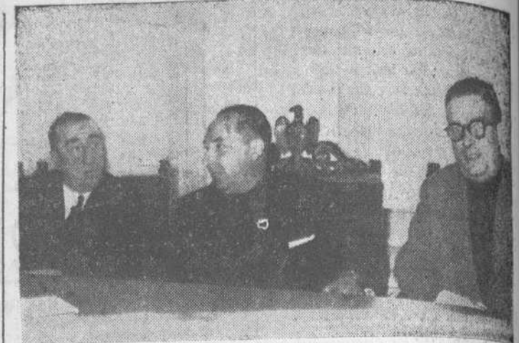
Presidencia de la Asamblea plenaria de Hermandades celebrada ayer. El gobernador civil con los presidentes, entrante y saliente, de la Cámara Agrícola

Habló seguidamente el señor Sánchez Arjona, que dijo: Sean mis primeras palabras para dar las gracias al señor