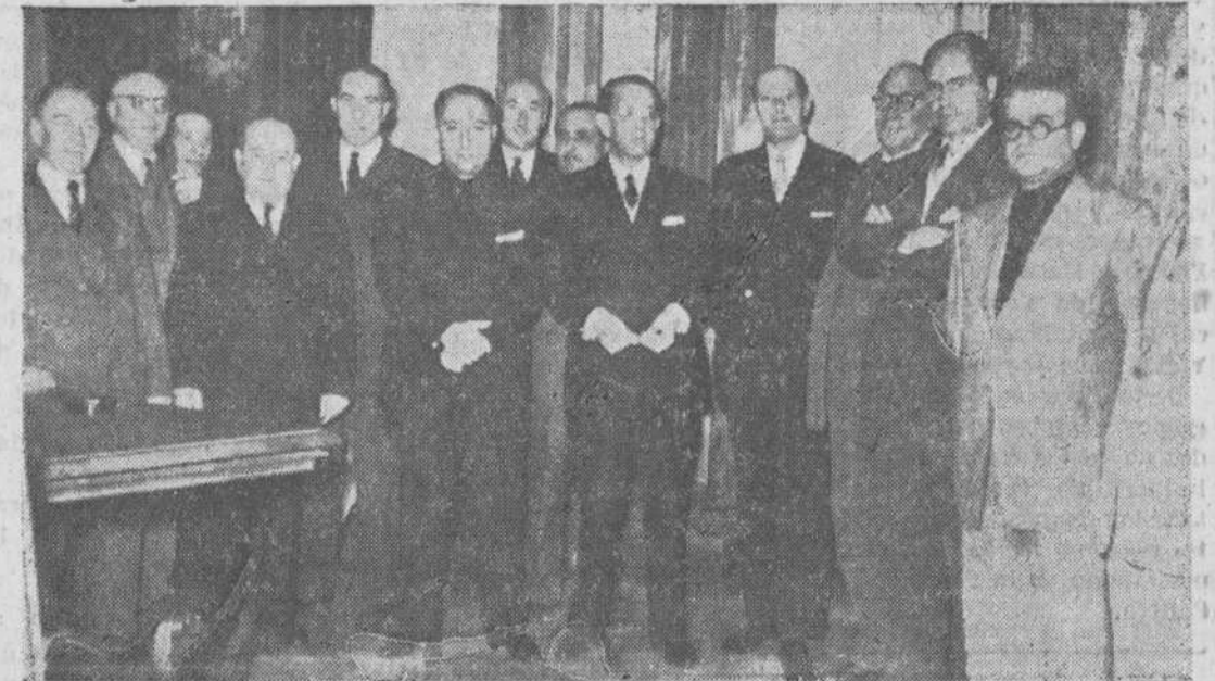
El Comisario Nacional del Paro con el gobernador civil y asistentes a la reunión celebrada ayer