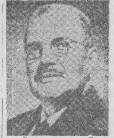
El nuevo presidente de Chile, general Ibáñez del Campo

Santiago de Chile.—Con vivas a Franco acogieron los parlamentarios chilenos a la embajada extraordinaria española cuando ésta llegaba al Congreso para asistir a la ceremonia de la jura del nuevo presidente de la República.