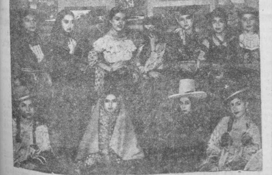
Algunas de las señoritas peruanas que, ataviadas con los trajes típicos de aquel país, obtuvieron un éxito al presentarse en el Teatro Español, ofreciendo un recital de danzas y canciones del Perú, dirigido por el escritor Miró Quesada