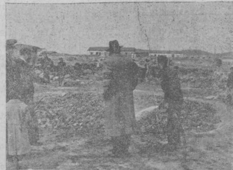
Con la cooperación del tanque municipal, se procede a matar la primera cal que se ha de emplear en la nueva barriada que el domingo comenzó a construirse.