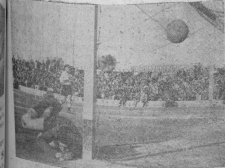
El domingo se jugó el partido Salamanca-Manchego, que terminó con la victoria del equipo local por 3-1. (Véase información en nuestro suplemento "Meta y Rueda")

La actualidad, recogida en las columnas de la Prensa, como pregón de actividades, va dejándonos el motivo a destacar. Pito no siempre surge ese rolé buscado, en el que hay e r un alto para meditar un poco. Hoy lo encontramos en esa información, casi perdida para el comentario, de un acto como homenaje de despedida a una profesora de primera enseñanza, que se jubila después de casi medio siglo dedicada a la enseñanza.