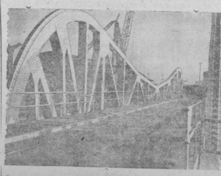
Su construcción ha costado 85.000 libras esterlinas. No pesa más de 54 toneladas y su longitud es de 27.50 metros. Admite tráfico ferroviario y de carretera.