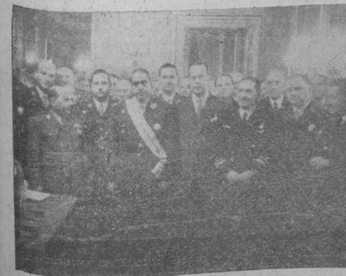
Los ministros del Ejército, Marina y Aire, con la Misión militar argentina, que preside el general Avalos, el embajador de su país en España, doctor Radio, con un grupo de generales y otras personalidades asistentes a la brillante recepción celebrada en honor de los militares argentinos, que regresan a su patria.