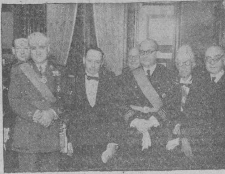
Los ministros de Educación Nacional y Obras Públicas, con otras personalidades, en el acto de descubrir la lápida en honor del Caudillo, en el salón de actos de la Real Academia de Farmacia.