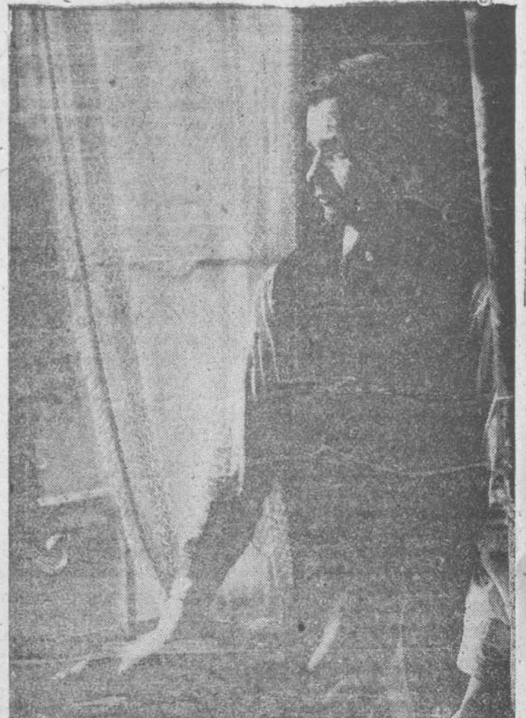
Fotografía de Rafael Gutiérrez Torres, titulada «Mi hijo», que mereció grandes elogios en el IV Salón de Otoño salmantino

Nutrida ha sido la representación valenciana, y buena en su