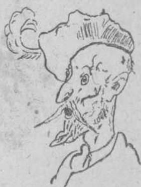
Don Quijote, por Carlos Pérez

Ahorrotado el caballo, brillantes los ojos claros, roja, entrecabierta la boca, al aire los frescos brazos, el muchacho pescadero me mira como estasiado. Y, al fin, murmura: —Sus fábulas me hacen pasar buenos ratos, las aprendo de memoria y las recorto y las guardo. Algunas ¡qué gracia tienen! Hacen reír hasta al gato. —Pues yo poco por lo grave —contestó el joven simpático— y lo que tú lees rienda suelta escribire llorando. Mi corazón de poeta tiene allí, en su fondo, algo de un oscuro madrileño que dió gloria al dos de mayo. Con otros muchos valientes iba a ser ejecutado y el que meataba las tropas viendo no sé qué en sus labios,