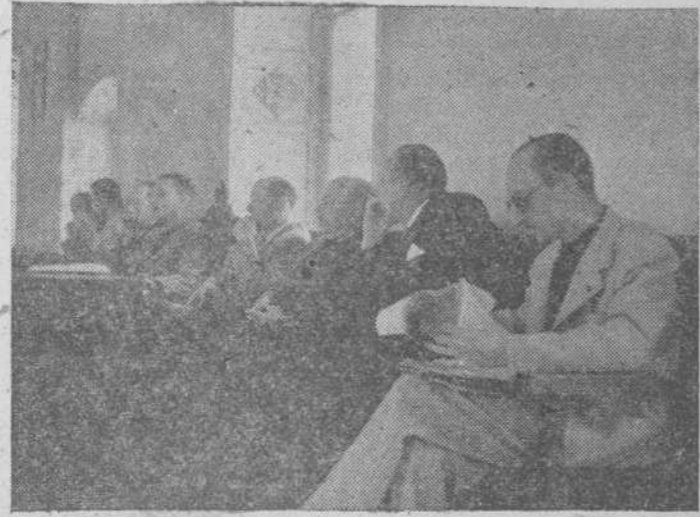
Presidencia del acto de apertura de la Junta de Mandos, celebrado ayer