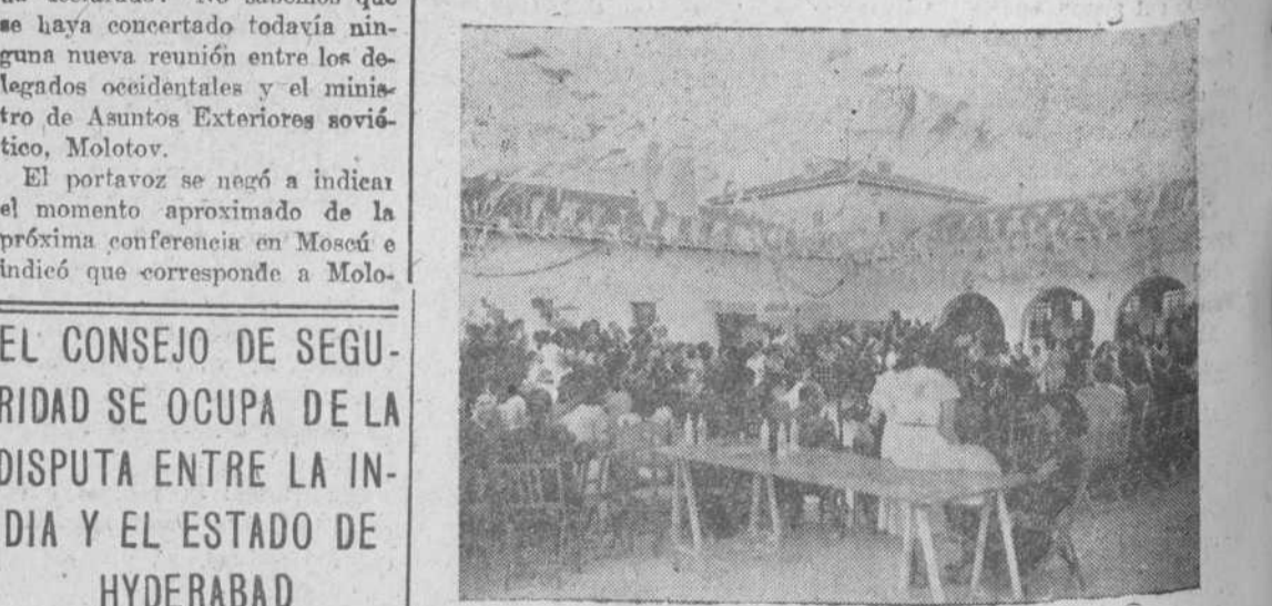
Alrededor de la pista de patinaje se agrupa el público que asistió a la kermesse del Secretariado de Caridad