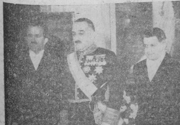
El nuevo embajador de Colombia, don Guillermo León Valencia, acompañado del introductor de embajadores, señor Barón de las Torres, y del ministro de su país, señor Casas, momentos antes de salir de su residencia para dirigirse al Palacio de Oriente, donde ha presentado sus cartas credenciales a S. E. el Jefe del Estado