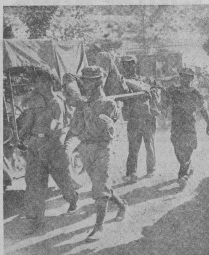
Soldados surcoreanos que están luchando junto a las fuerzas de las Naciones Unidas, transportan a un fusilero de Marina norteamericano herido a un puesto de socorro.

Tokio.—El comunicado del Cuartel general de Mac Arthur dice: "Las fuerzas de las Naciones Unidas continúan su avance a todo lo largo del frente coreano. En el sector noroeste la 37 brigada británica progresó unos dos kilómetros. Elementos de la 24 división norteamericana mantuvieron en actividad sus posiciones y en gran escala, acción que permitió entrar en contacto con el enemigo intermitentemente. Las patrullas avanzaron más de tres kilómetros hacia el norte sin establecer contacto. Elementos de la primera división de Caballería norteamericana realizaron ganancias de terreno limitadas, pues enviaron patrullas de reconocimiento hasta a ocho kilómetros al norte sin establecer contacto con el enemigo."