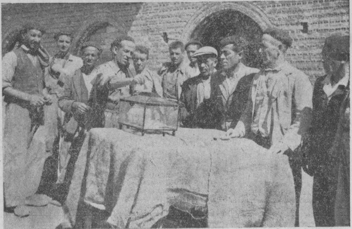
Un momento de la votación para elegir enlaces jurados en a empresa Mateos, de Cud d Rodrigo

Las elecciones sindicales en esta primera etapa de elección de enlaces jurados de Empresa y compromisarios para las etapas siguientes están desarrollándose con plena actividad. Ayer recogimos en la Delegación Sindical Provincial el estado actual de esta elección cuyo detalle es el siguiente: El Sindicato de Cereales ha verificado ya la elección en las panaderías y prepara la de sus restantes centros de trabajo; el del Espectáculo hizo ayer las de los teatros, hoy hará la de la plaza de toros y el próximo domingo la del campo de deportes de la Unión.