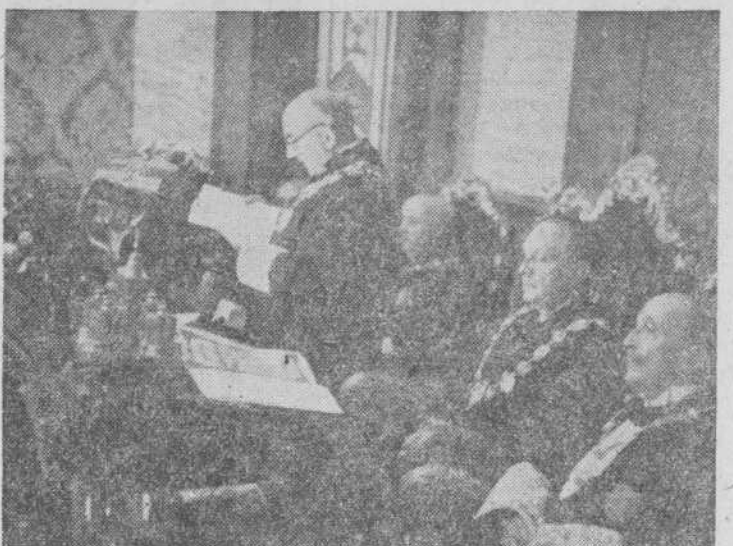
El presidente del Tribunal Supremo señor Castán Tobeñas, leyendo el discurso de apertura. En la presidencia, el ministro de Justicia y otras personalidades