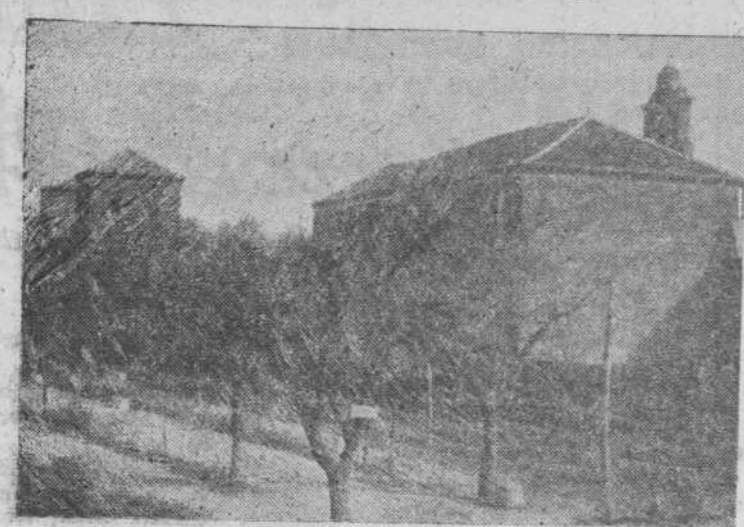
Palacio de don Juan II, donde nació la Reina Católica. (En la parte posterior del cuerpo de iglesia, que es lo que está delante de la torre, se halla una estancia que llaman las Claustillas y en ella nació la Reina)