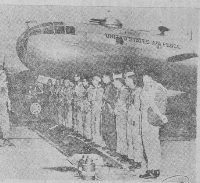
Antes de salir para prestar un servicio de bombardeo sobre la Corea comunista, el piloto jefe de este B-29 dirige una arenga a su tripulación

Durante las últimas veinticuatro horas, las fuerzas de las Naciones Unidas realizaron pequeños avances hacia Chinju y al reducir la cabeza de puente de Changtong también han logrado contener los ataques comunistas en los sectores de Waegwan y Yangju. Una fuerza especial ha avanzado entre tres y medio y cuatro kilómetros hacia Chinju contra la fuerte resistencia de los coreanos.