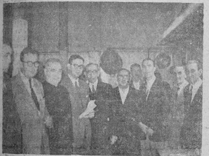
El delegado sindical con el Jurado