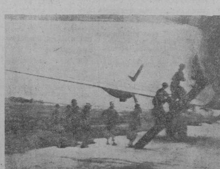
En esta fotografía, transmitida por radio, aparecen soldados norteamericanos subiendo a un avión de transporte para su traslado al frente de Corea