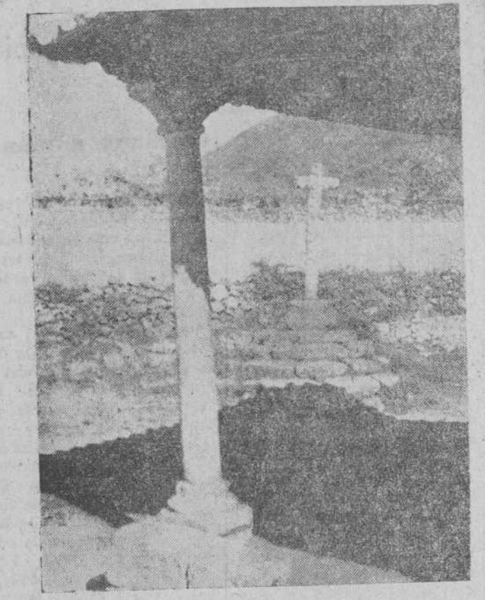
Una ermita salmantina abre su porche al cuadro de un bello panorama

Y sor Pura, emocionada, teñidas las mejillas de un ligero carmín, levantó con mano suave el mechón de rizados y negros cabellos