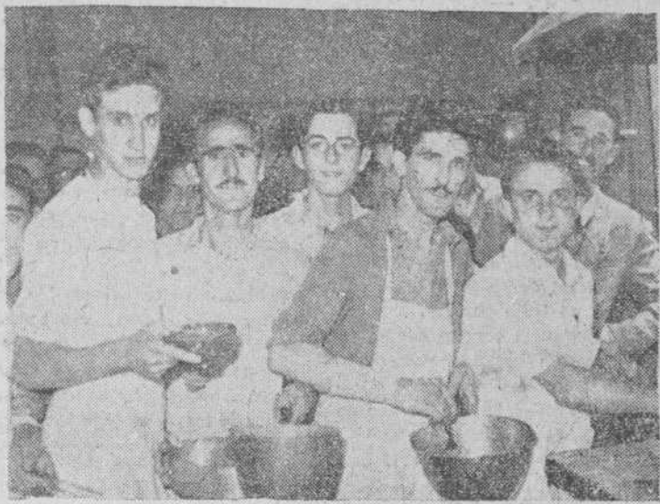
Grupo de concursantes

Todos los concurrentes, a un mismo tiempo dieron comienzo a su trabajo con gran laboriosidad y rapidez, aunque no tenían tiempo limitado. La prueba fue muy interesante y curiosa, ya que los confiteros concurrentes habían de poner todo su arte y el mejor gusto para realizar un trabajo bello y bien terminado. En todo momento tuvieron a su alcance los materiales necesarios, realizándose trabajos de un verdadero gusto confiteril, donde