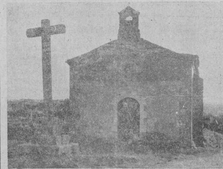
Ermita de la Vera Cruz de Alameda de Gardón

Por último, ocho Comunidades tienen su residencia en esta diócesis, que con la salmantina se reparte la mayoría del territorio provincial.