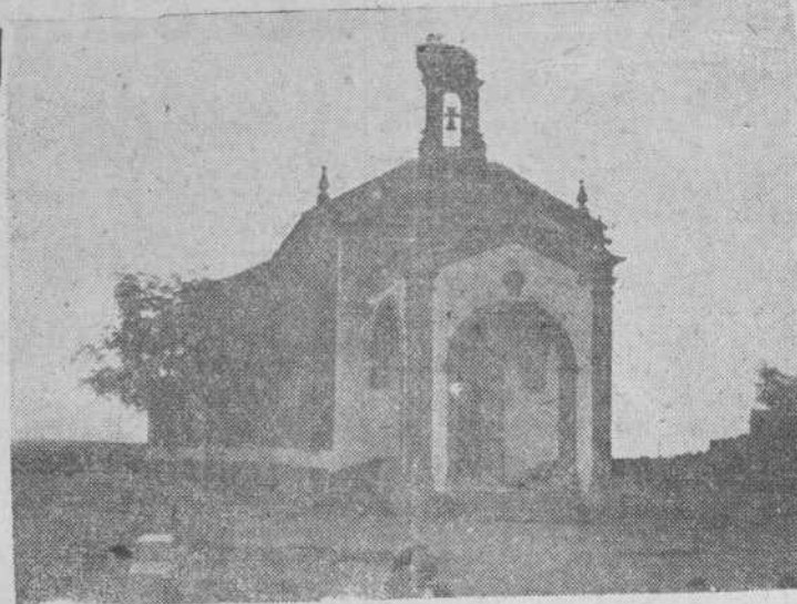
Ermita del Santo Cristo de la Exaltación (imagen sacada en rogativas famosas en Gallegos de Arzañán)

Otros trece pueblos dependen de la diócesis de Avila, todos ellos en el límite oriental de la provincia, llegando hasta el de Cantaracillo. Cuatro más son de la jurisdicción episcopal zamorana: Pelilla,