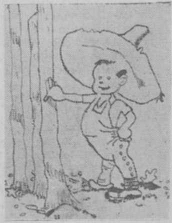
"Pancho", por Domingo Vicente