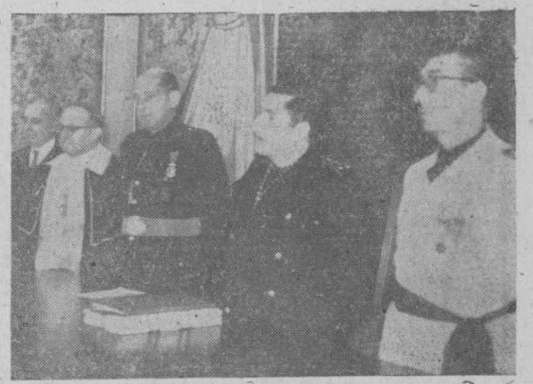
La presidencia del acto celebrado en la Diputación

Bonn.—El ministro de Asuntos Exteriores francés, Robert Schuman, ha pedido la "colaboración alemana" al llegar a Berlín. Manifestó al alcalde interino que Francia y Alemania deben esforzarse en llegar a algo más que a una inteligencia. "Colaboración" dijo —debe ser la meta.