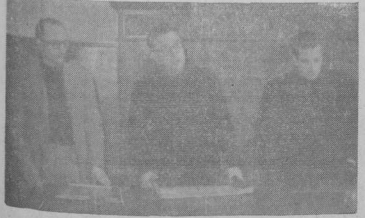
El delegado provincial de Sindicatos, en el uso de la palabra, durante el acto celebrado en la C. N. S.