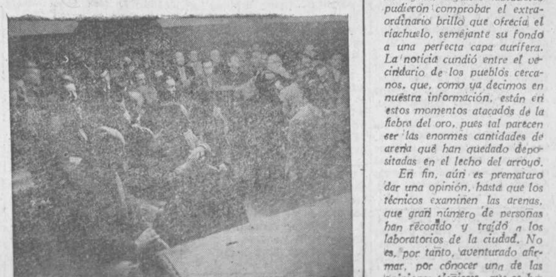
Aspecto del salón de actos de la CNS durante las sesiones de estudios de la asamblea provincial de Hermandades.

Es el diario más antiguo de la capital y provincia