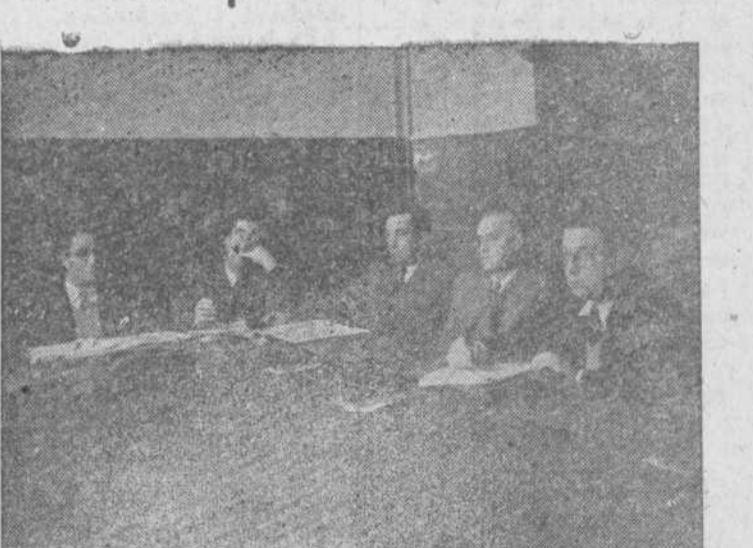
Un aspecto de la presidencia de las sesiones de trabajo de la asamblea provincial de Hermandades que comenzó ayer.

Así, estas sesiones de estudio, lejos de ser un congreso ruidoso y luego intrascendente, se transforma en un íntimo y completo cambio de impresiones que permite concordar las posibilidades comunes y distinguir a su vez la diferenciación propia de cada comarca en relación con sus problemas y orientaciones. Son, en fin, sesiones de trabajo, de clara expresión, que abarcan por entero todos los problemas del campo, encauzándolos por el camino más eficaz posible, cual es la Hermandad, la Cámara Oficial Sindical Agraria, proyectándose hacia los poderes públicos en colaboración, pues, con el legislador.