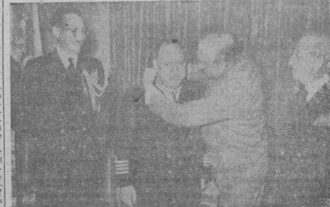
Al capitán de navío, don Fausto Saavedra Collado, le ha sido concedida la medalla de la Legión del Mérito Norteamericana. Aparece en la foto el embajador de Estados Unidos en Madrid, mister Stanton Griffis, en el momento de imponer la condecoración al marino español.