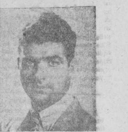
elío podrá ensalzar y pregonar con satisfacción el nombre de España.

—A qué es debido que te encuentres estudiando en nuestra Universidad? —Yo fui combatiente en el Ejército americano. Al licenciarme, el Gobierno nos compensó con el abono de tantos años de estudios universitarios, por años de servicios prestados.