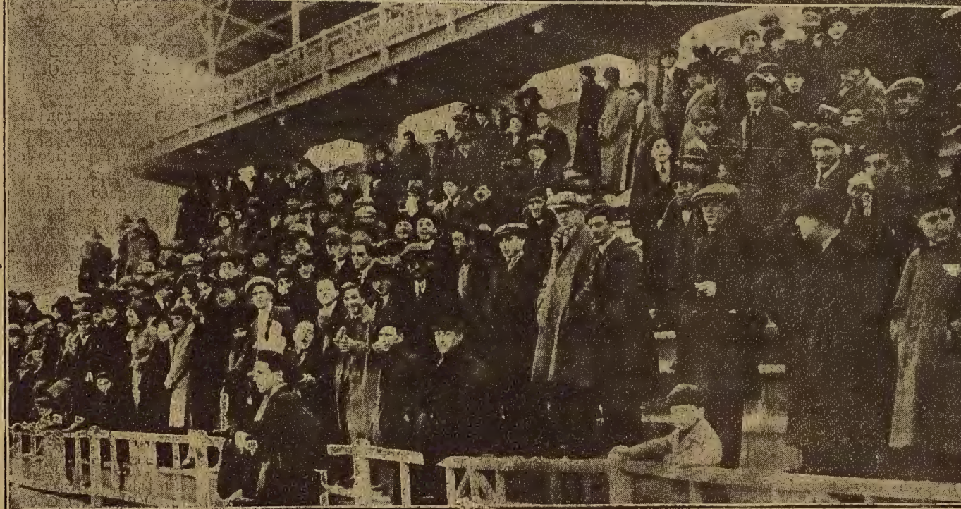
DEL PARTIDO DE FUTBOL JUGADO EN ZARAGOZA EL DOMINGO POR LA MAÑANA.—Arriba, el equipo Borja S. D., que empató a uno con el Juventud Zaragoza. Abajo, un aspecto del público, en el que figuraban muchos entusiastas aficionados de Borja.

vista, sino porque en conciencia no las creo intencionadas, conociendo la corrección y deportividad de ambos equipos.