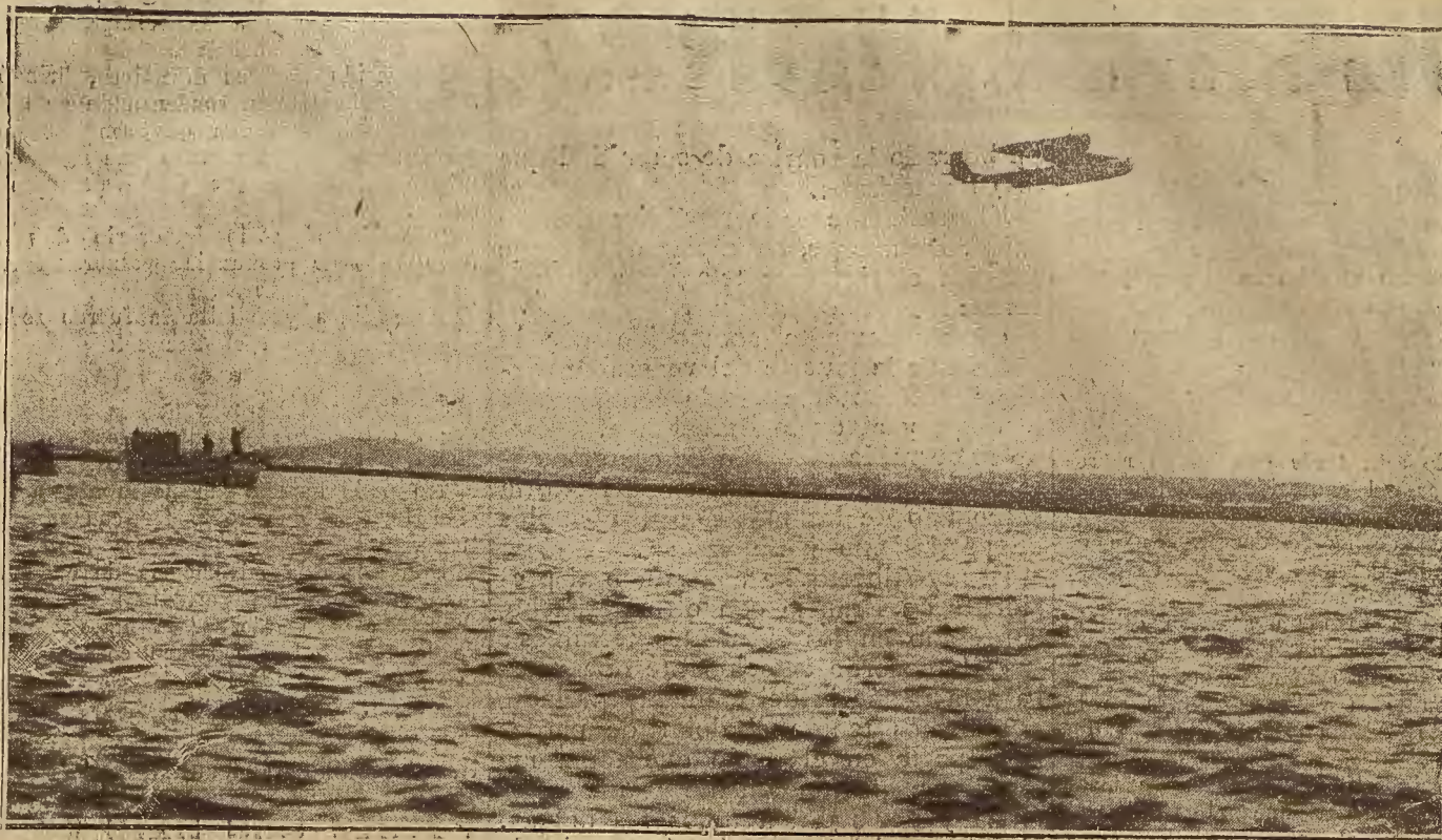
DEL VIAJE AEREO ESPAÑA BUENOS AIRES. —Momento de salir de Palos de Moguer el hidroavión «Plus Ultra» en su vuelo hacia Las Palmas, primera escala de su viaje a América.

Esto supondría el replanteamiento del asunto que entraría en la nueva fase que todos desean. El mismo Consejo de Obras públicas indicará el modo de hacer el replanteamiento y, en caso preciso, señalará la