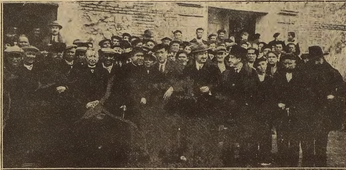
DE LA ASAMBLEA QUE SE CELEBRO EL DOMINGO EN MARIA DEL HUERVA PARA TRATAR DE LA CONSTRUCCION DEL PANTANO DE LAS TORCAS. — La comisión gestora (en primer término) rodeada de assembleistas.

Una asamblea.--Fe y optimismo.--Los pueblos están dispuestos a que se haga el pantano.--Entra el asunto en una nueva fase.--Conclusiones aprobadas