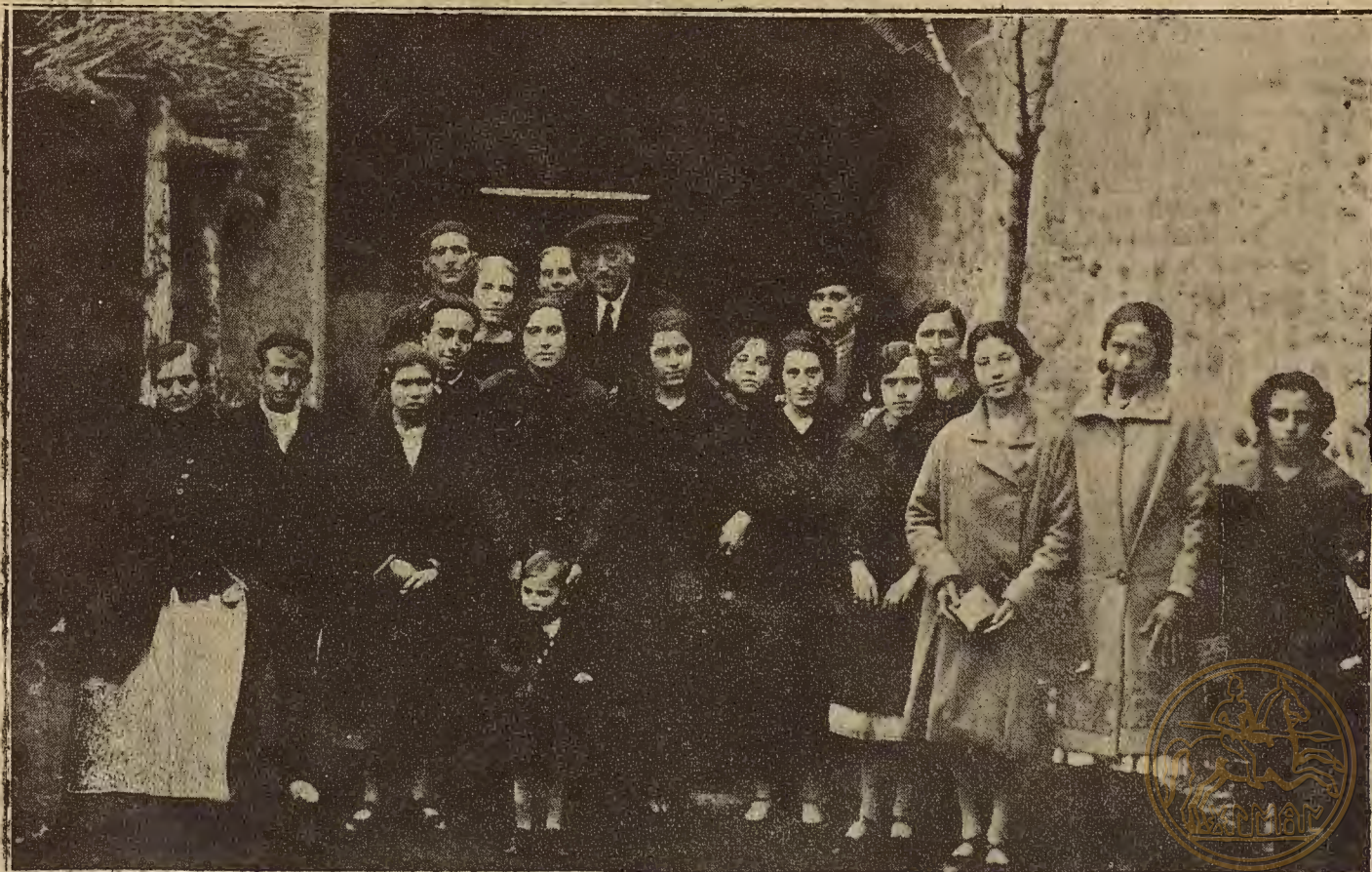
EN MARIA DEL HUERVA.—Mientras se celebraba la asamblea para tratar del proyectado pantano de las Torcas, nuestro compañero Aracil anduvo tras el elemento femenino del pueblo para lograr esta fotografía