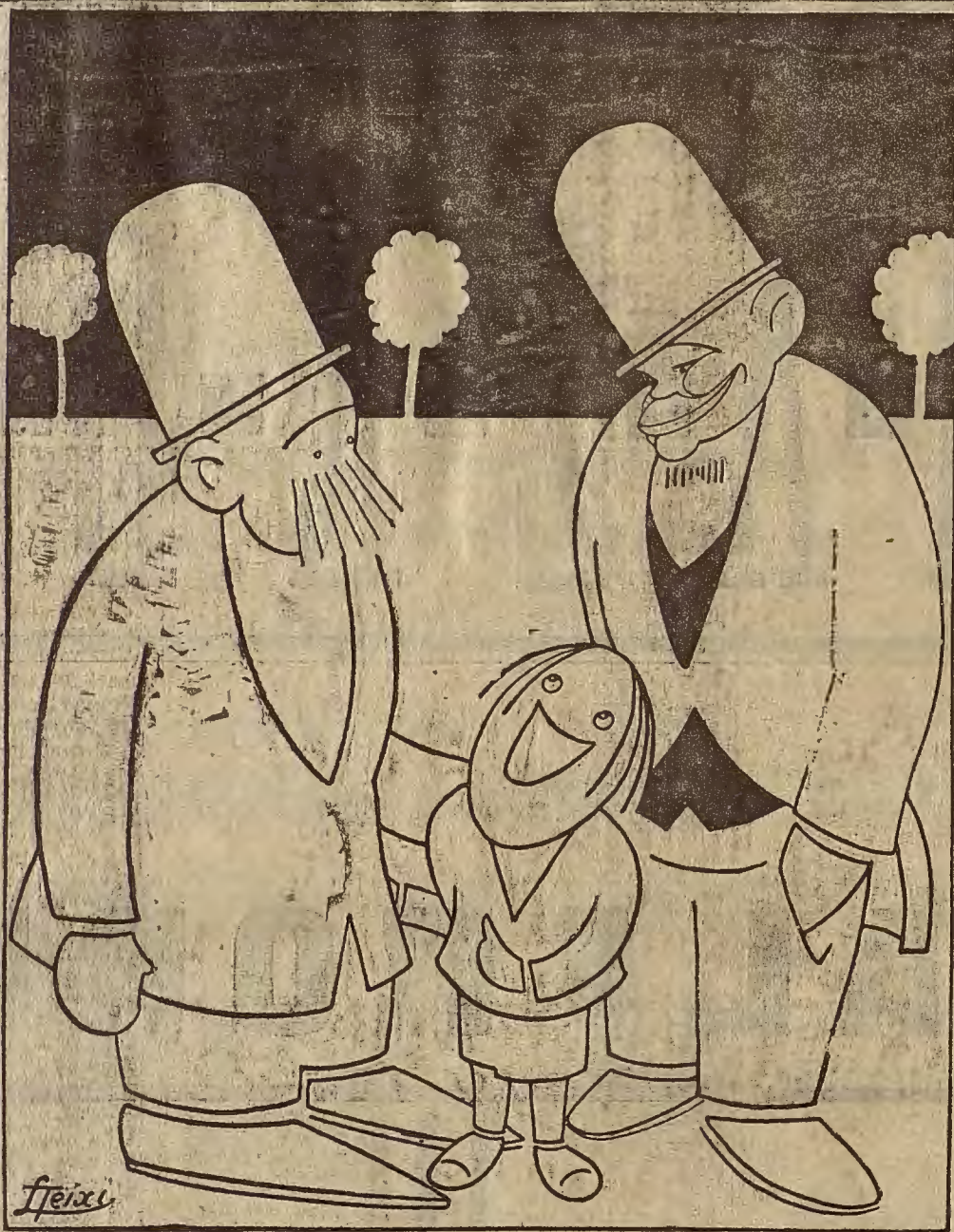
LOS NIÑOS DEBIERAN HABLAR CUANDO...

¿Va a lograr un día la humanidad que sus vehículos corran como la luz y como el sonido?