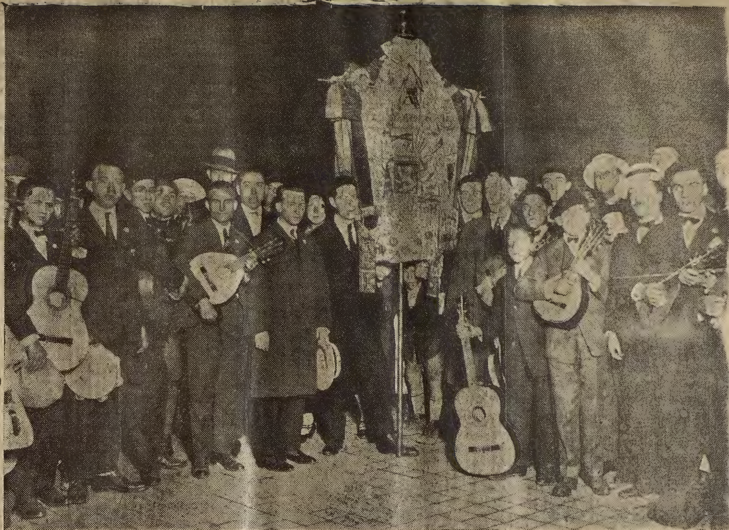
MADRID: LLEGADA DEL ORFEON ZARAGOZANO.—En los andenes de la estación de Mediodía momentos después de apearse del tren

Cuando las lechugas son crecidas, están aptas para el relleno, se quitan los cabos, se lavan bien, se ponen a cocer en agua hirviendo con sal, y cuando están medio cocidas, se sacan sin maltratar. Se escurren en una tabla limpia, se comprime el picado como para las cebollas, con el caldo de los huesos de la carne, se vuelven a exprimir las lechugas para que no quede verdor. Cuando están escurridas, se cogen por abajo y se ensanchan las hojas de una a otra parte y se pone en medio más bulto que el tamaño de un huevo del picado. Se van cogiendo las hojas de una parte a otra, de modo que vuelvan al cabo.