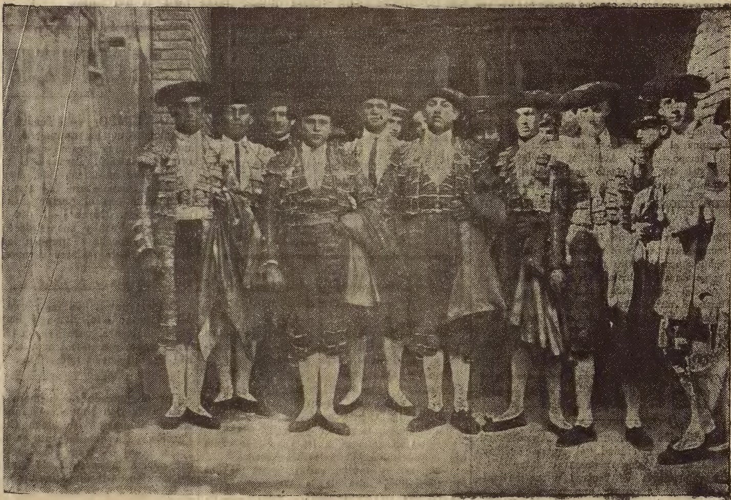
Las cuadrillas, formadas por muchachos del regimiento de Pontoneros, que actuaron en el festival que ayer tarde se celebró en la plaza de toros de Zaragoza.

Sobre las dos de la tarde de ayer descargó en la población y parte del término una fuerte y aparatosa tormenta, con acompañamiento de gran cantidad de agua, que, si bien para el campo no ha de ser de gran utilidad, pues las cosechas salieron más que mal paradas de la sequía sufrida, sirvió al menos para refrescar la temperatura, que ya empezaba a devenir acto seguido a la inauguración de la feria senta con los colores de nuestro H. A.