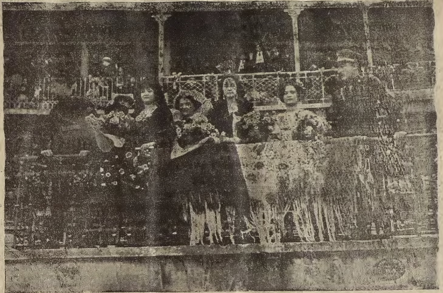
Señoritas que presidieron el festival celebrado ayer tarde en la plaza de toros de Zaragoza por los Ingenieros Militares.