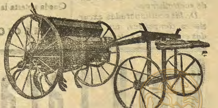
Sembradora-abonadora con avanzón, marca LABAD