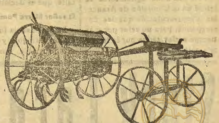
Sembradora-abonadora con avantren, marca LABAD

Fabricantes: Labad, Mur y Compañía S. L. Plaza de Doña Sencha, 3. Teléfono núm. 258-R HUESCA