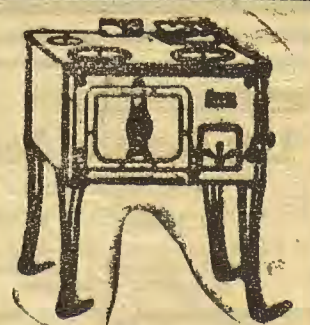
Ha trasladado sus talleres, por ampliación de negocio a la calle Mayor, núm. 61.

Fábrica de Fumistería Zaragoza Teléfono 21-12