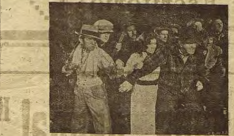
Una bella escena de «La Horda Argentada», película que se estrena hoy en el ODEON

Napoleón decía que el niño había de comenzar a educar veinte años antes de nacer... Y tenía razón, porque una madre viciosa no daría sino vicios a la sociedad; el niño, por instinto, tiende