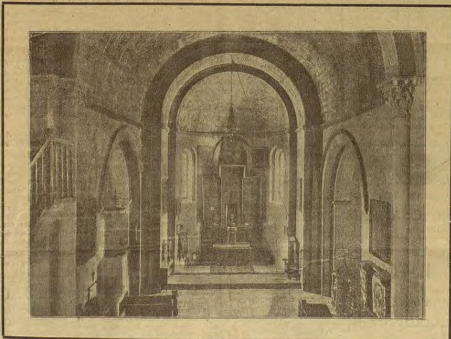
Santa Cruz de la Serós. Interior de la Iglesia

Jaca, magnífica residencia veraniega y Universidad de verano con cursos para extranjeros que duran de 1.º de Julio a 31 de Agosto.