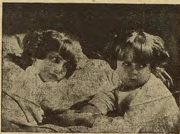
La graciosísima cómica,