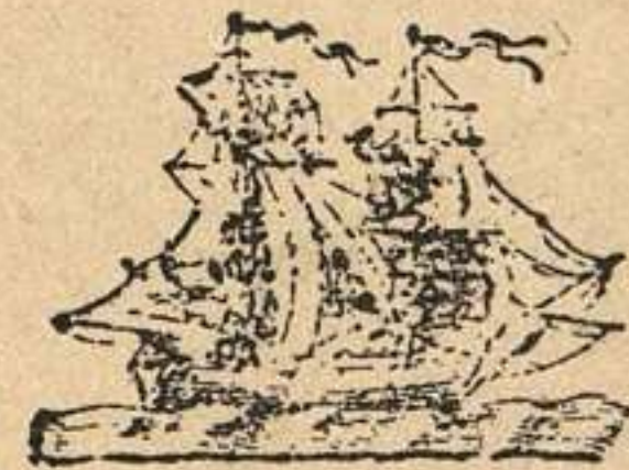
Paquete de Inglaterra.

Extraordinario á Chile y Perú. —La noticia que el Patriota Argentino nos hizo el favor de comunicar é insertamos en el número anterior, produjo todo el efecto que él mismo manifestó proponerse. El Miércoles á la tarde salió un extraordinario con pliegos para Chile y Perú comunicando la direccion que llevaban el navio español Asia de 64, y el bergautin Aquiles de 18, los cuales esperamos que mientras dirigen sus consultas desde la isla de las Mochas á la corte de Madrid sobre á cual de las dos autoridades realistas en el Perú han de prestar obediencia, se vean atacados por la maldita fiebre que asalta á todos los marineros españoles en el Pacífico—esto es, la de estipular con alguna de las autoridades independientes los medios de regresar á Europa con bastantes viveres para no perecer de hambre en la navegacion. Esperamos tambien que este asunto ha de proveer las columnas del Argos de artículos curiosos, para proporcionar de nuevo á nuestros lectores aquellos grandes ratos que gozaron al principio de la revolucion en que la marina española tuvo una parte activa en resistirla: de este modo el desenlace vendrá á ser tan divertido como lo fué en su origen en tiempo de las mechas de los Argandoñas , los Córdobas , y los Michilenas .