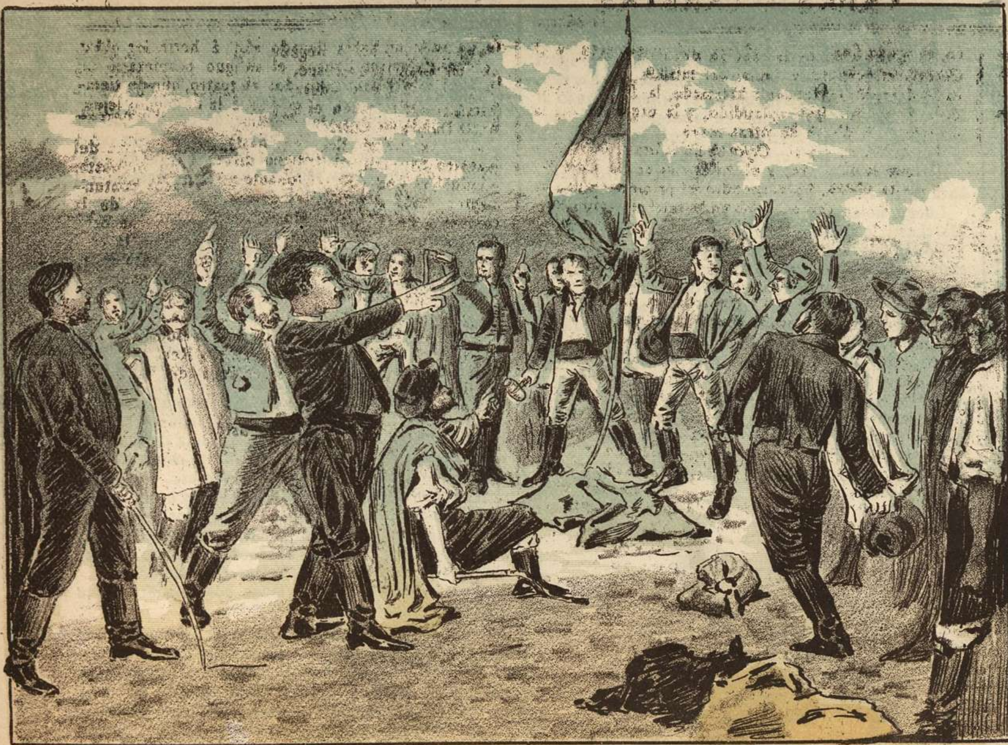
JUAN M. BLANES—El remate de una bandera

hasta hoy; pero en aquel tiempo gobernaba el inolvidable don Máximo Santos, y los habitantes estaban acostumbrados á ver cosas maravillosas.