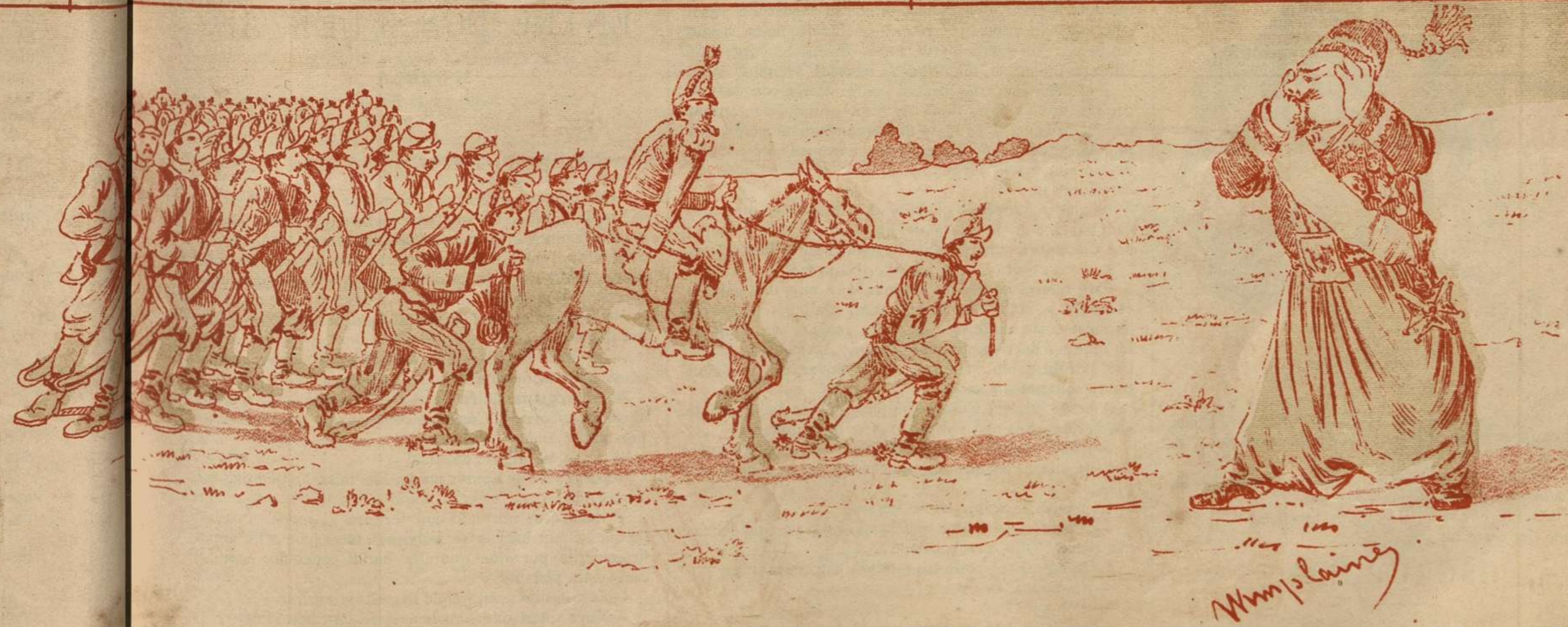
Por lo que hace á la revista de las fuerzas de caballería, lo único que se le oyó decir fué: «¡Oh mon Dieu, mon Dieu! «Qu'est que c'est ça!»