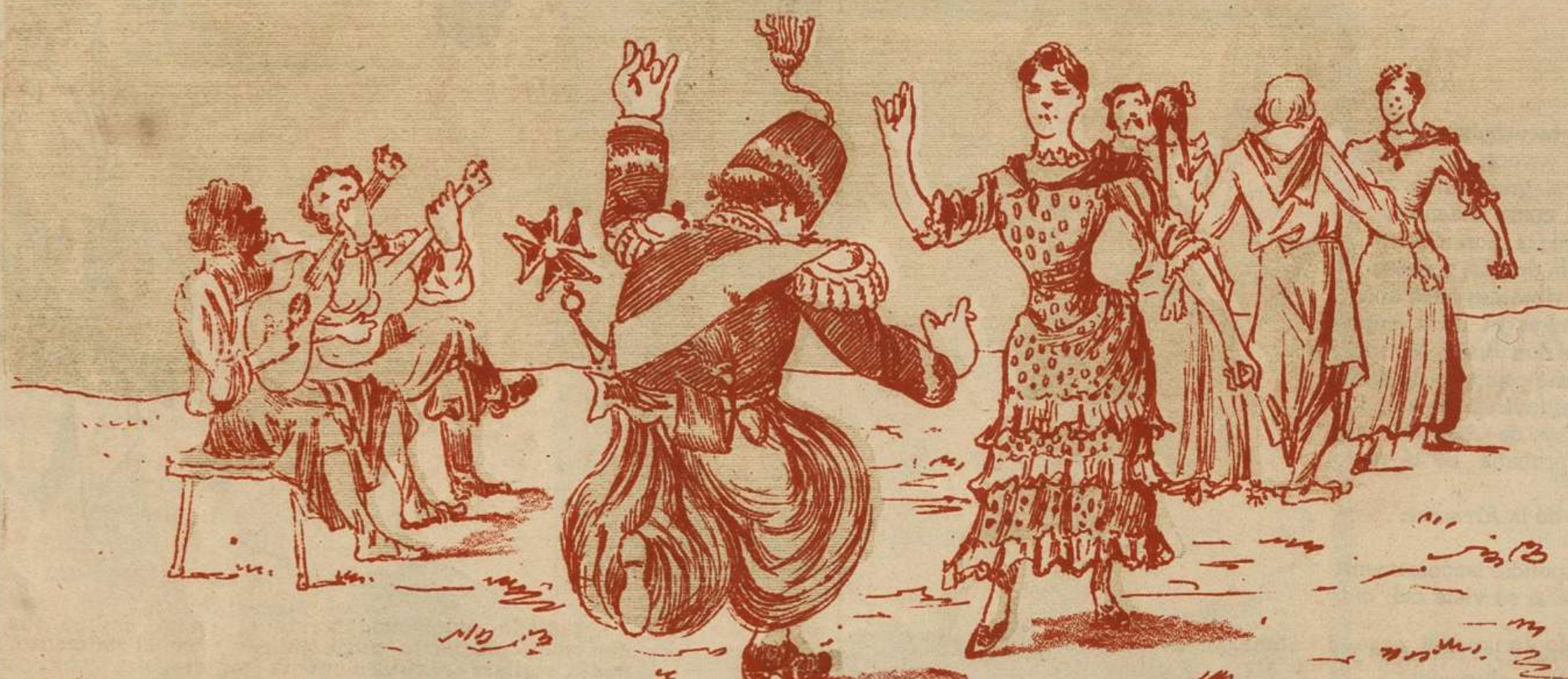
Se dieron la mar de fiestas en su honor. Y el repitiendo siempre aquello de que «il faut être démocrate» echó también su piernita en el pericon, aunque ¡claro! tuvo que bailar a la moda de Paris. Pero no parecía «cancan» ¿eh?!