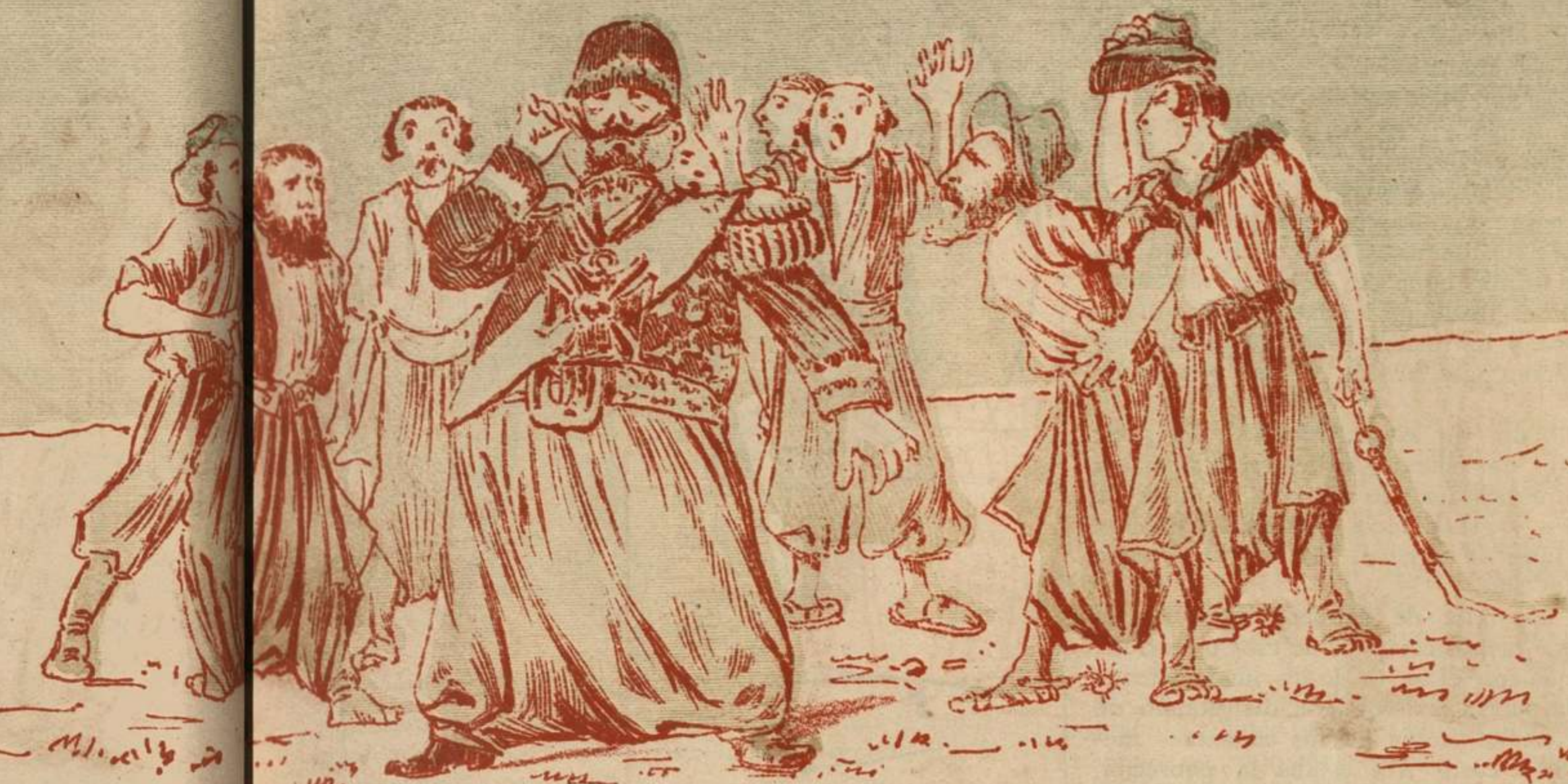
Las manifestaciones de admiración fueron numerosas, como no se habían hecho nunca á ningún ministro. Pero es lo que él decía: «No basta ser ministro sino «saber» ser Ministro!»