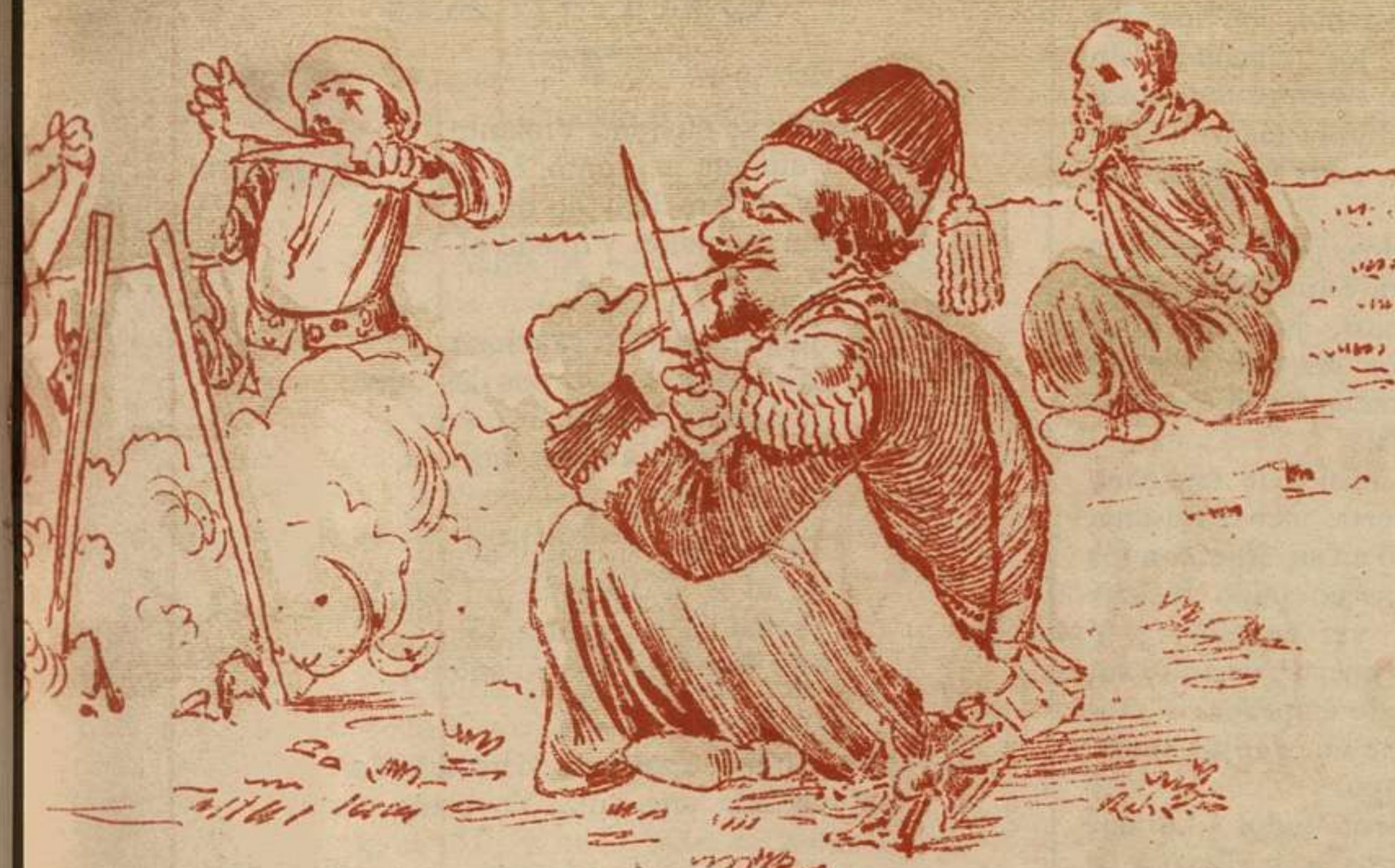
No obstante cuando se llegó el caso de comer á la criolla el asado con cuero, se le oyó murmurar: «¡Oh! Cuánto cuesta «être démocrate!»