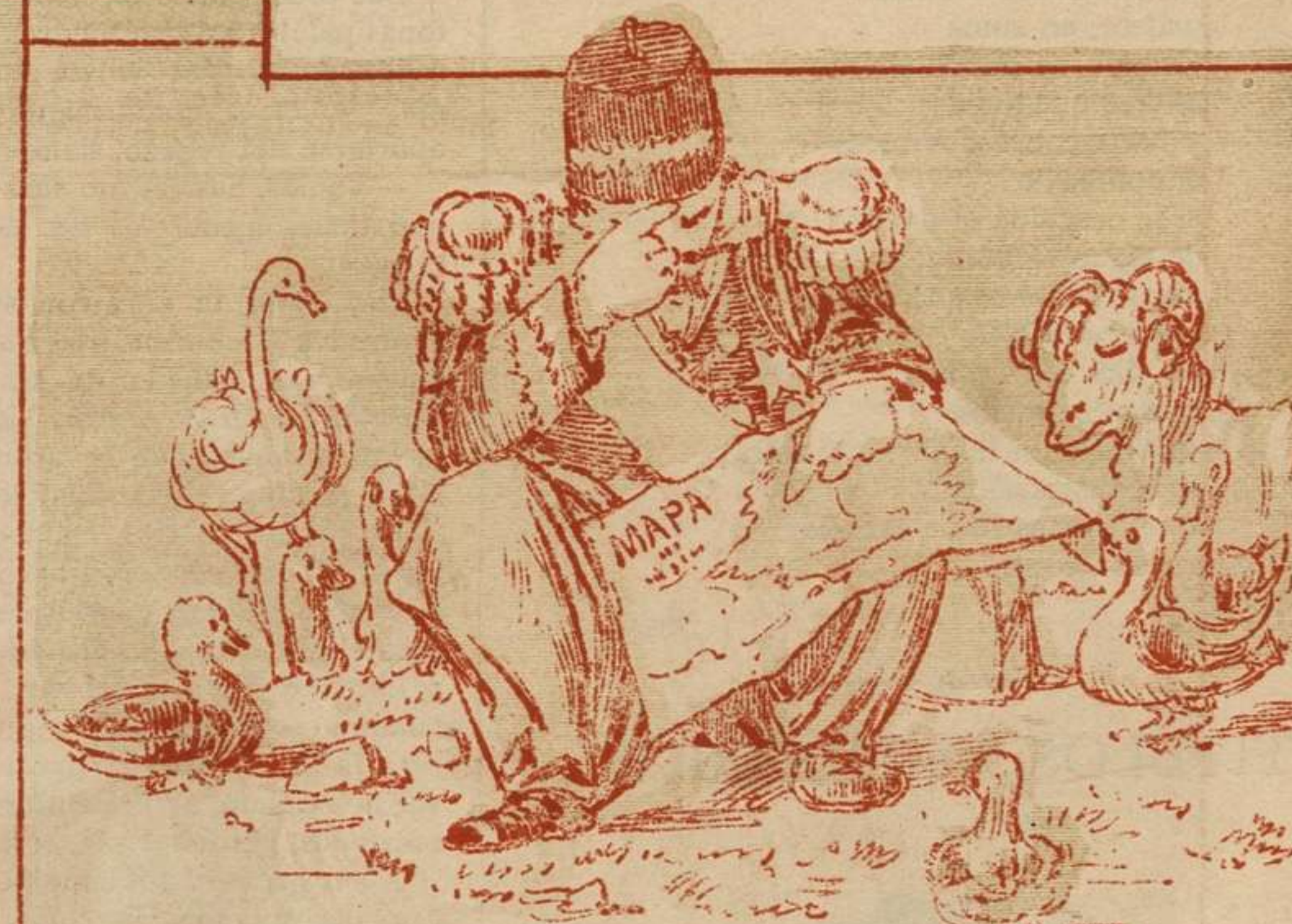
Estudiado concienzudamente el plano, dedujo que con ciento cincuenta mil hombres, por el momento, podía vigilarse regularmente la frontera.