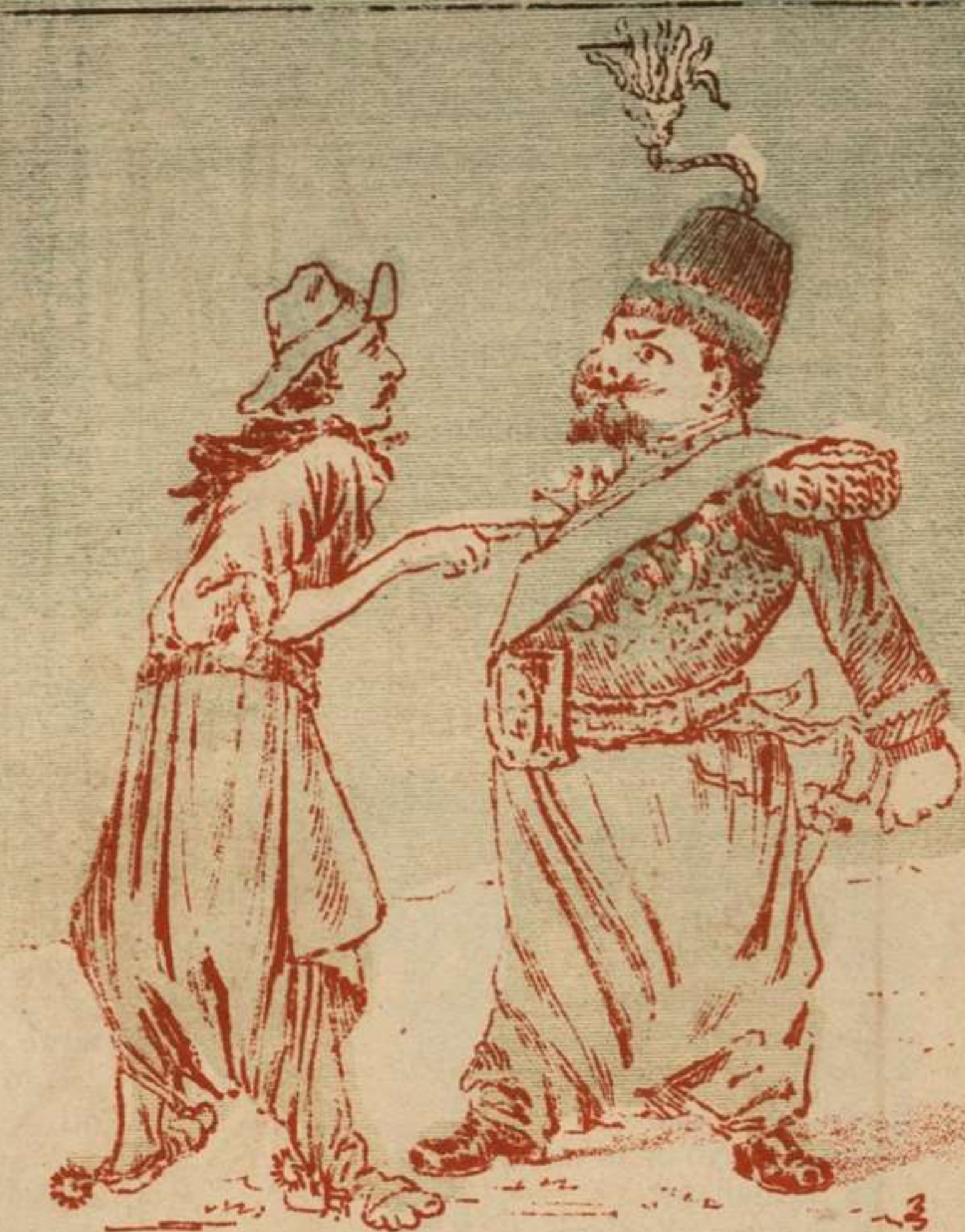
Eso sí, como nunca falta alguien que no esté al cabo de los usos de la «haute» francesa, dió con un criollo que le dijo: «¡Ah tigre! Poco «chapeao» se ha venido. Diga, ¿Vende estas latas? Lo que le hizo exclamar para sí: «¡Oh mon Dieu! «Chapeao»? Si le habrá gustado «non chapeau!»