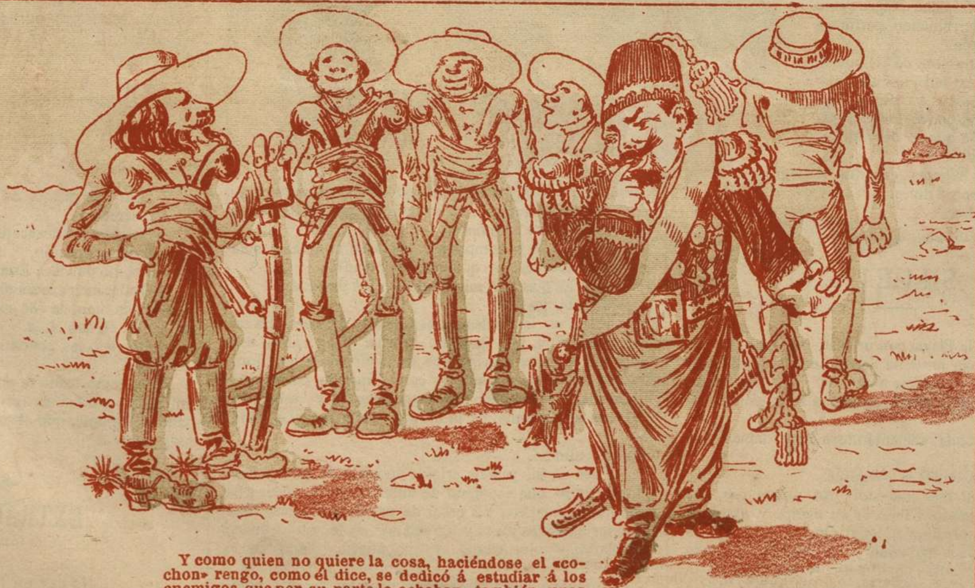
Y como quien no quiere la cosa, haciéndose el «cochon» fengo, como él dice, se dedicó á estudiar á los enemigos que por su parte le echaban también unas miraditas algo....