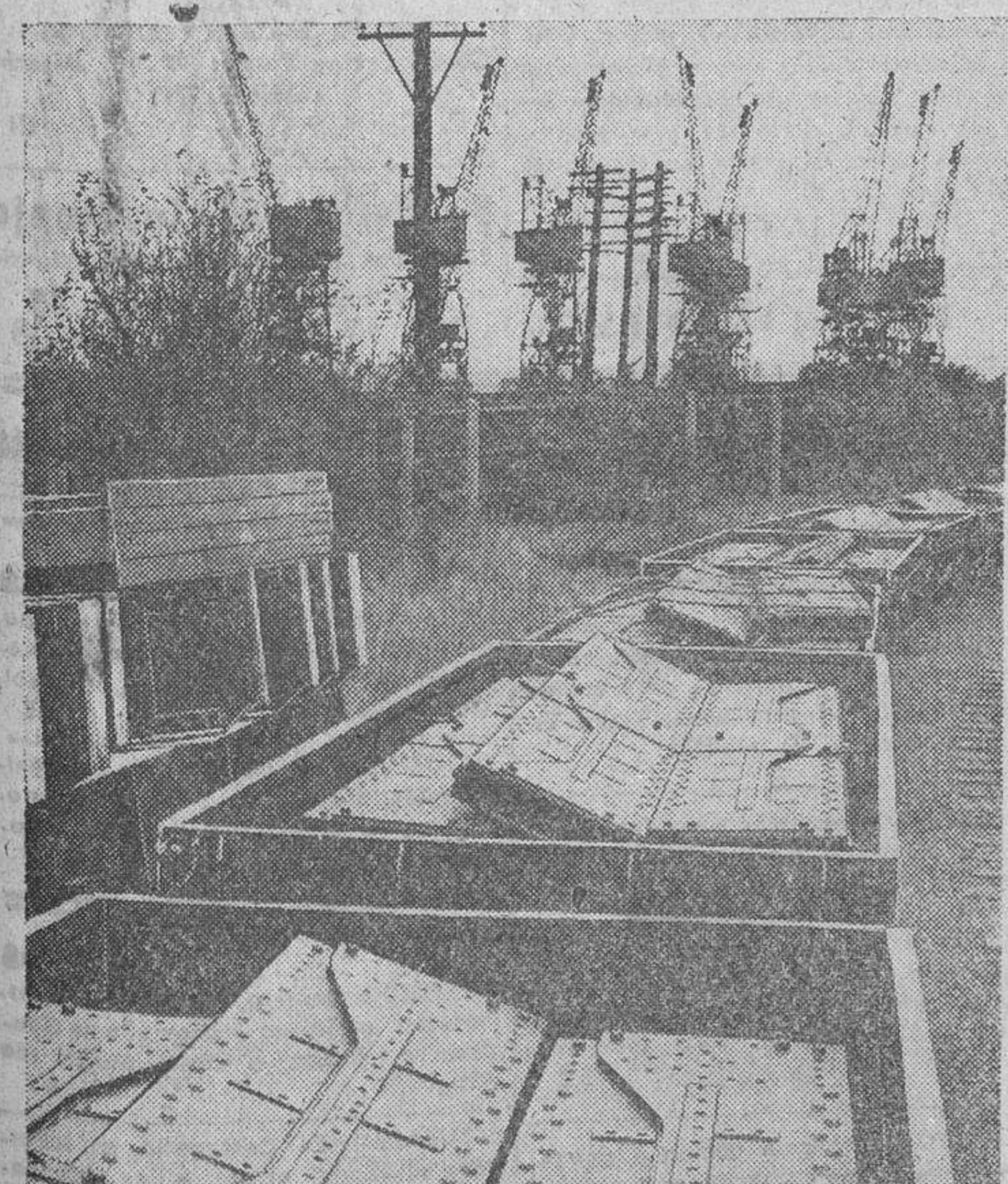
Los primeros abastecimientos que la UNRRA envía a China para establecer las comunicaciones internas de aquel país, se están embarcando en el puerto inglés de Tilbury, en la desembocadura del río Támesis. Trátase de piezas prefabricadas para la construcción de 900 puentes.