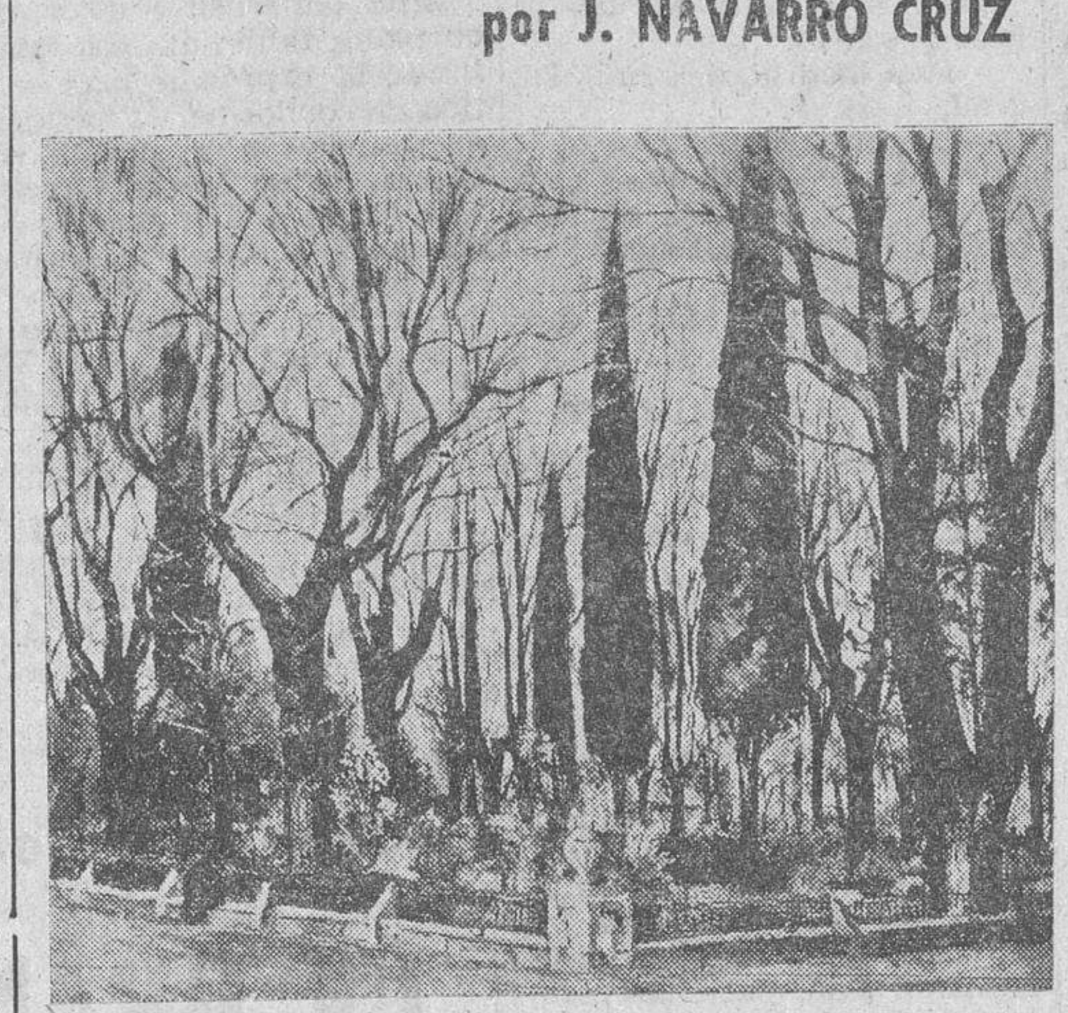
"Campo de San Francisco", óleo de González Ubierna

Se va haciendo obligatoria esta aparición anual de González Ubierna, en su Salamanca, en estos días que anteceden a las Navidades. Tras él viene su arte, como un adelantado a la cita, que después otros artistas locales han de completar, quizás movidos por el estímulo y la cariñosa acogida que obtienen, sirviendo todo ello para que no hayamos acostumbrado a que la ciudad tenga también su "temporada artística", todo lo recoleta que se quiera, pero temporada al fin, que afianza conquistas conseguidas y alienta con los últimos resultados económicos obtenidos, a perseverar en el trabajo sin olvidar, que con estas manifestaciones se amplía y aquilata una afición, menester indispensable para que nuestros artistas prosigan en la ruta emprendida.