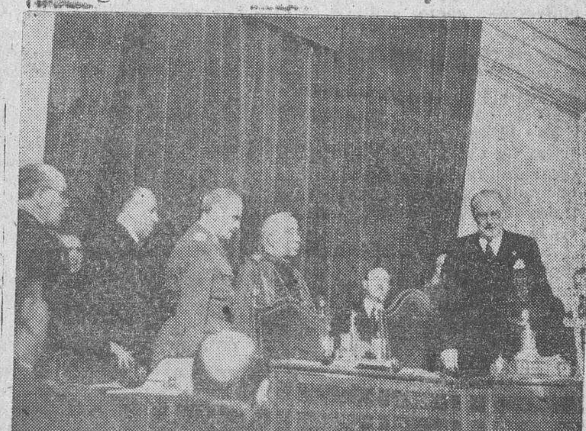
El presidente de las Cortes, don Esteban Bilbao, tomando juramento a los nuevos procuradores, antes de comenzar la solemne sesión, el pasado jueves.