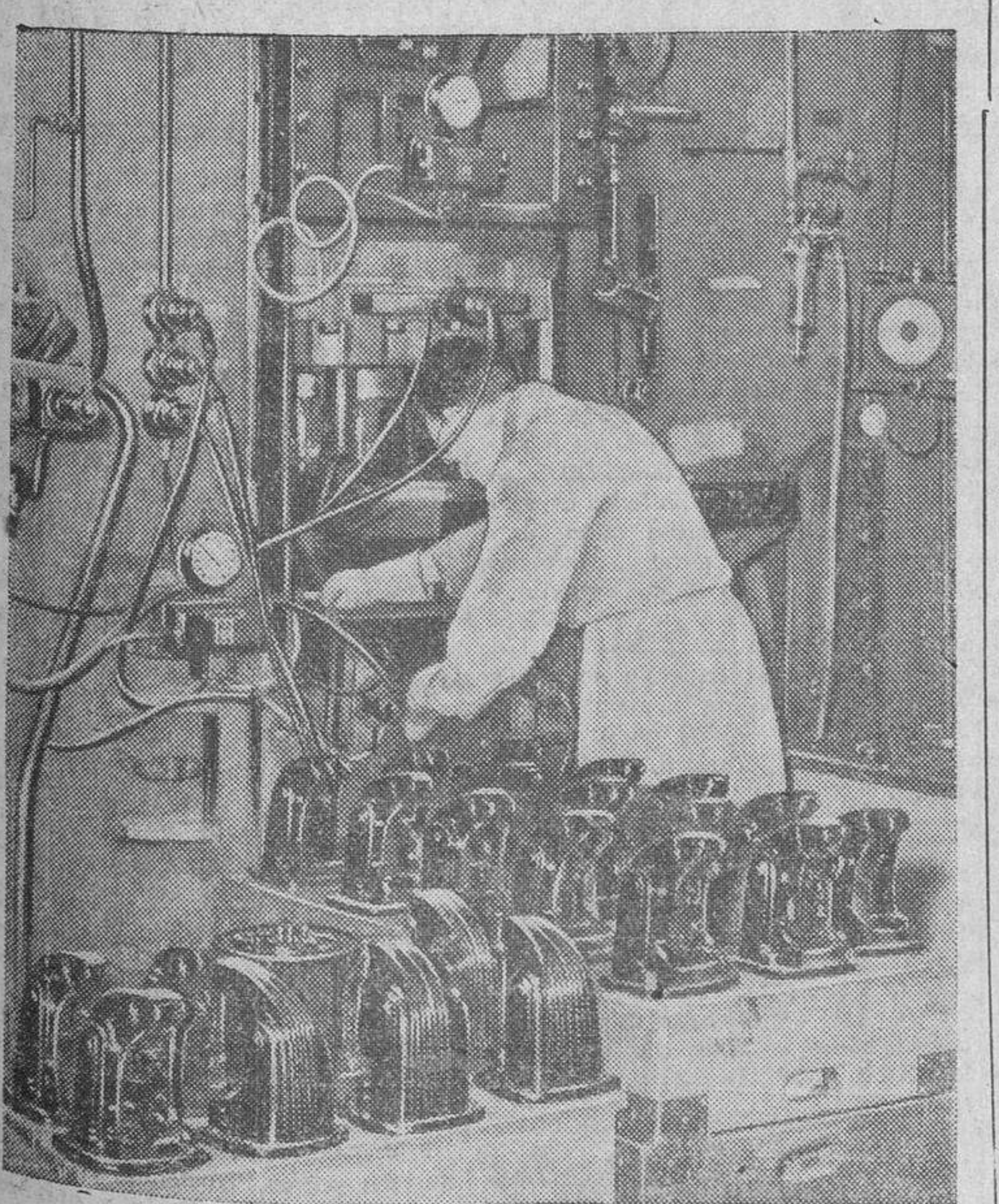
Piezas moldeadas de material plástico, para aspiradores, de modelo complicadísimo, fabricadas en las mismas navas, en las que durante la guerra se moldeaban cajas para los reguladores y economizadores de oxígeno. (Foto Calpe).

En la Plaza de España esperaban a Su Excelencia, el capitán general de la octava región militar, teniente general Mújica; gobernador civil de la provincia, alcalde de Santiago y Ayuntamiento en Corporación y representantes oficiales.