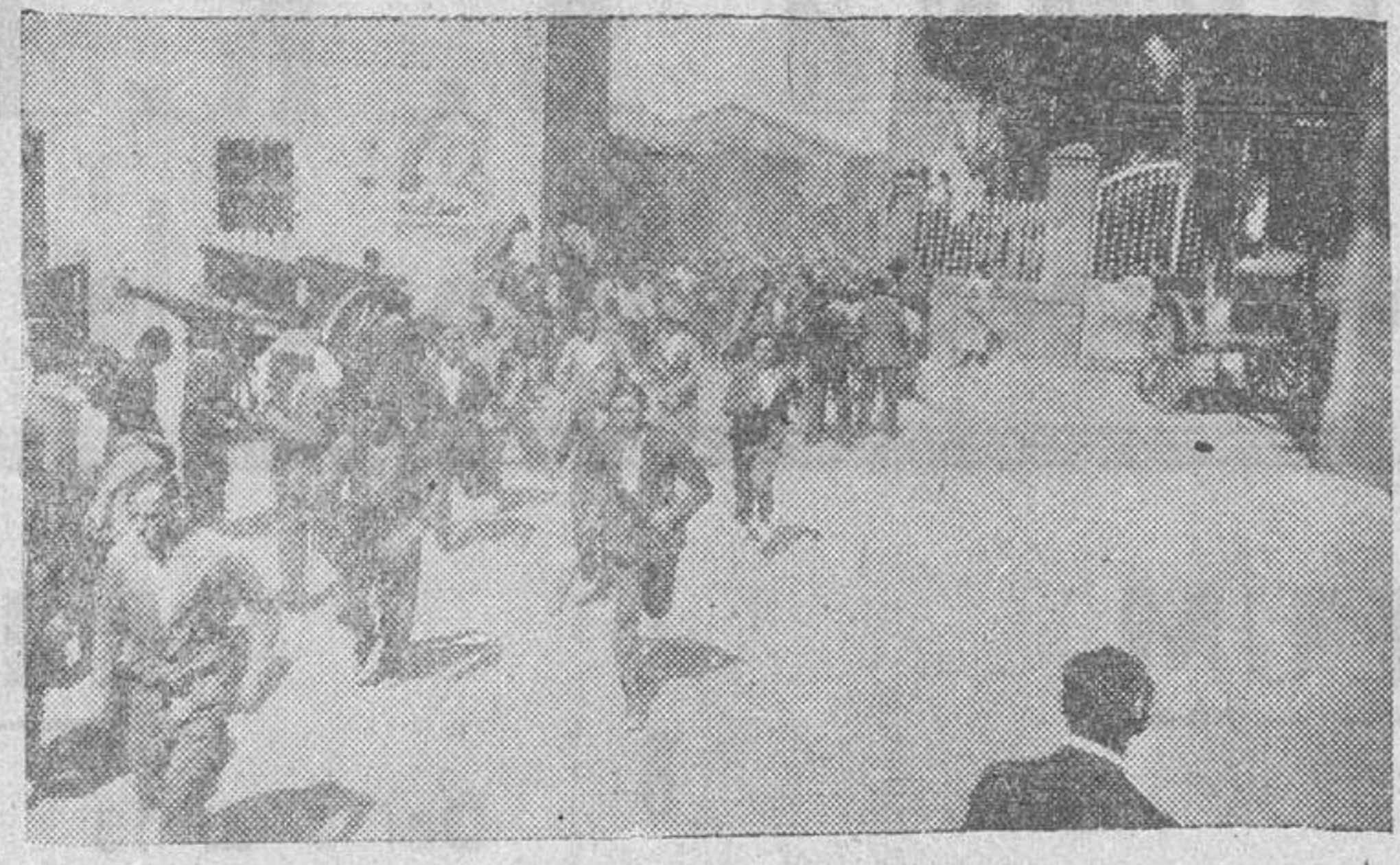
El público, por la calle de la Fandanga, corre abocadamente delante del encierro

Más tarde, y ya sin interrupción, el comentario obligado, de día y de noche, aquí y allí, en torno a los próximos días, a las corridas proyectadas, los festejos en preparación, las visitas al ganado de la Hlida, el arreglo de la plaza, la distribución de los palenques... Y llegan, por fin, las fiestas: «Los Novillos», como se dice en el pueblo y en toda la región. Las vísperas todo es ajeteo y actividad. La plaza, esa rítmica con callado de la villa, solitaria y austera como buena plaza castellana, sufre en tales días una transformación radical, construyéndose en toda su amplitud los palenques y graderías que darán acceso a la muchedumbre en trance de fiesta popular y taurina.