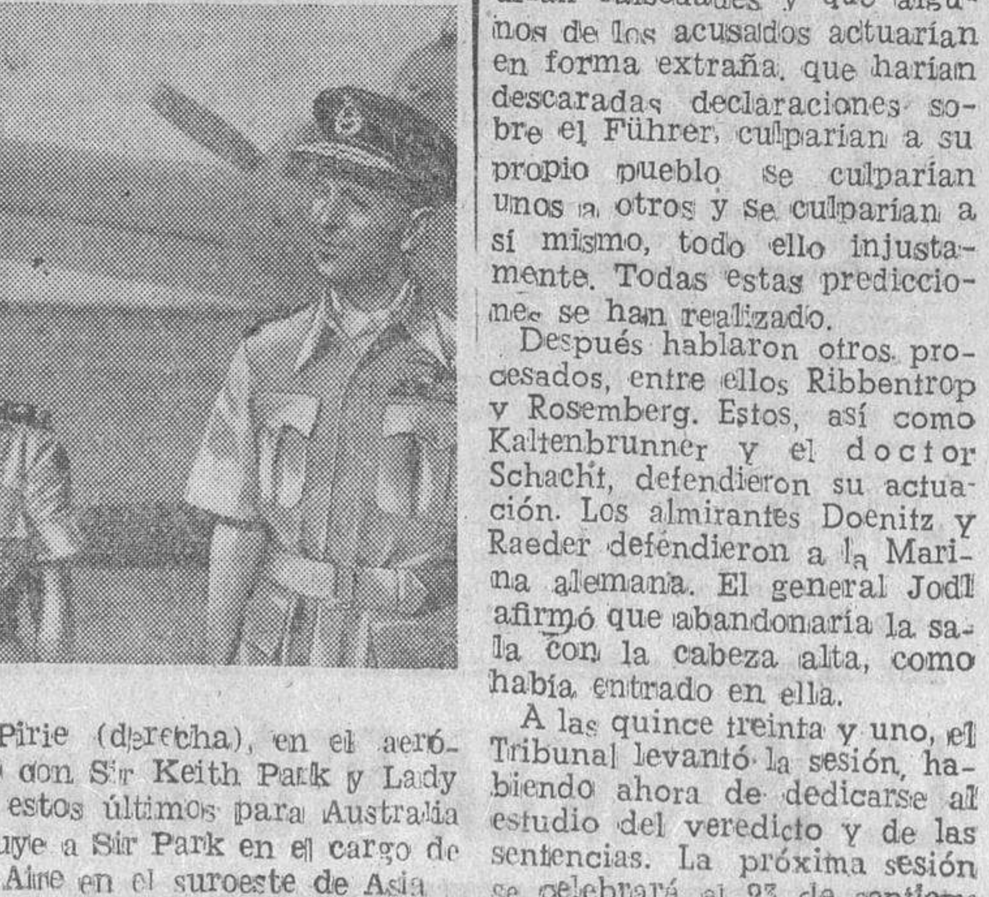
El mariscal del Aire, Sir C. C. Pirie (derecha), en el aeródromo de Singapore, fotografiado con Sir Keith Park y Lady Park, la esposa de la salida de estos últimos para Australia y Nueva Zelanda. Sir Pirie sustituye a Sir Park en el cargo de comandante en jefe aliado del Aire en el sureste de Asia.

Agregó Sofoulis, que la oposición no tendrá más remedio que aceptar la Monarquía como forma constitucional, a menos que Inglaterra y los Estados Unidos la recomendarán. A pesar de todo, las fuerzas antimonárquicas continuarán luchando por la República dentro de la ley. (Efe.)