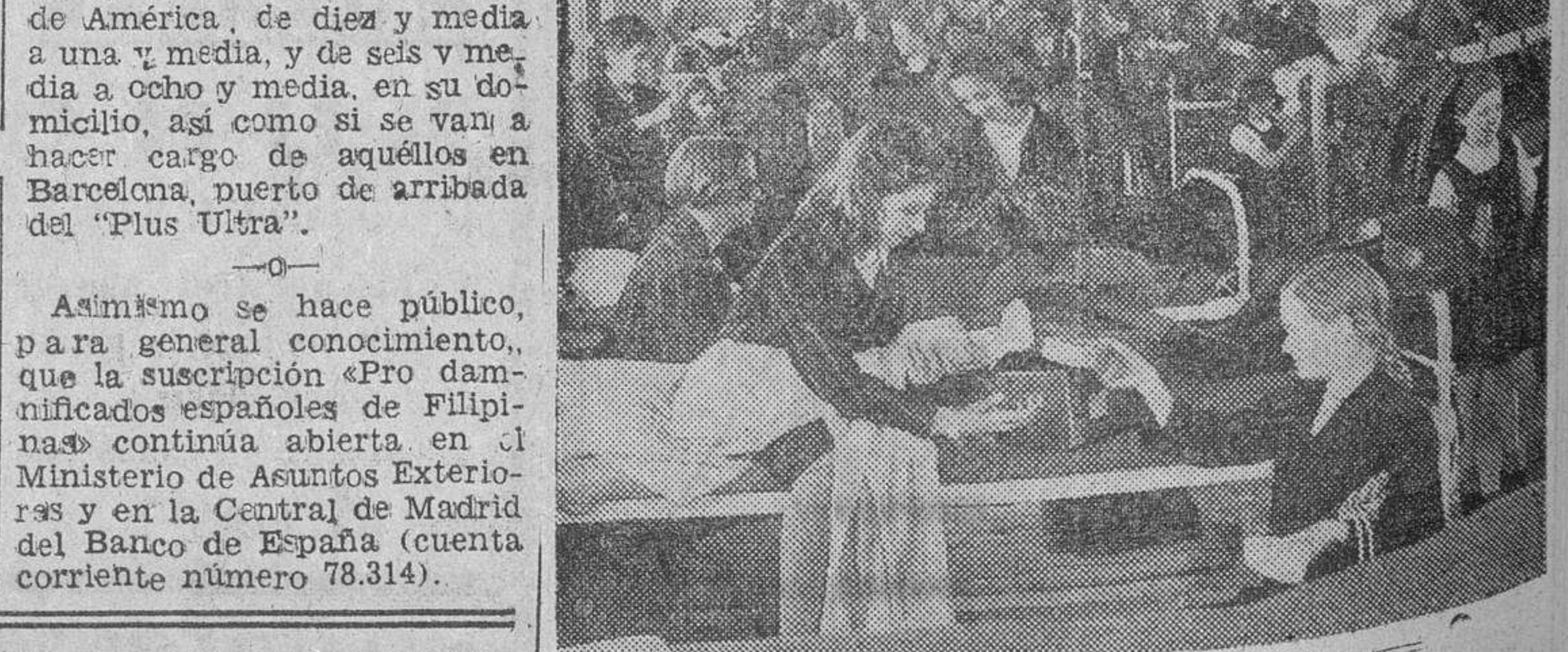
Vista del interior de una sala-dormitorio de uno de los barracones perfectamente equipados, perteneciente a la organización británica de los Campamentos Escolares.