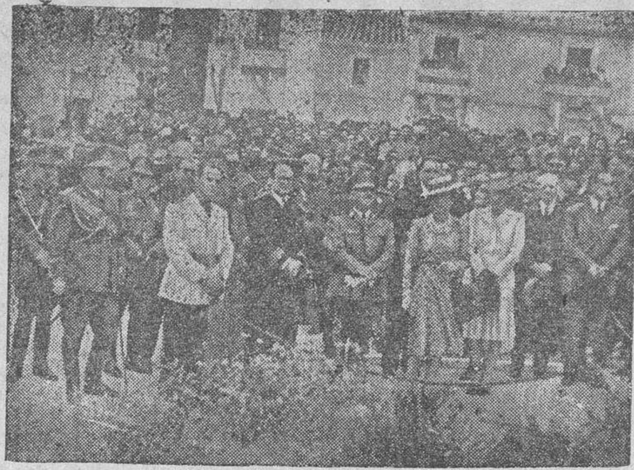
El Generalísimo Franco, con su esposa, los ministros y demás personalidades que asistieron a los actos celebrados en Lebrija, escuchan los discursos pronunciados ante el monumento erigido en memoria de Nebrija.