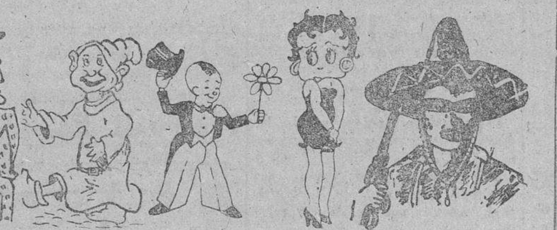
De izquierda a derecha: «El gato con botas», por Epi Rabazas; «Jacinto Quincecos», por Pedro G. Casado; «El Mudo», por Jesús Rodríguez (Pedrosa); «Pompey y la Betty», por Paquita Martín (Aiba de Tormes); «El Coyote», por Carlos de Onís