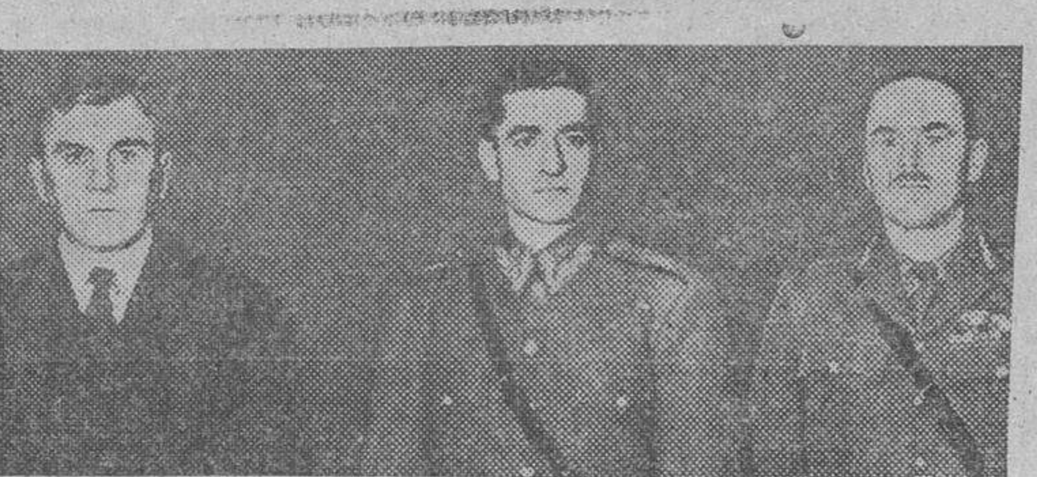
Con motivo de la retirada de las fuerzas inglesas que quedaban en Irán, el general Savory y Sir Reader-Bullard, embajador británico, fueron recibidos por el Shah de Persia, en su palacio