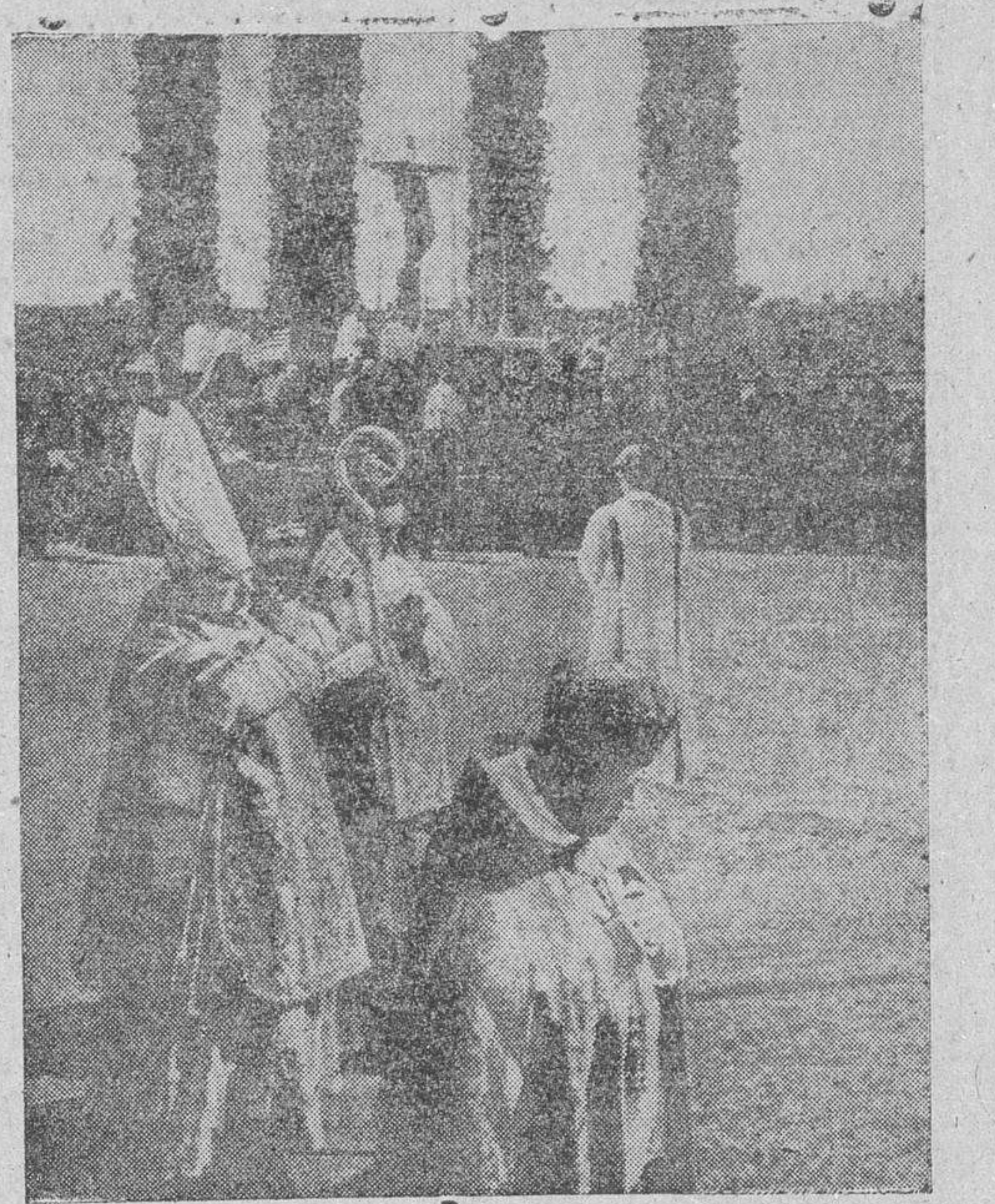
El Nuncio de Su Santidad, monseñor Cicognani, en el momento de dar la bendición a los asistentes al Congreso Catequístico celebrado, el domingo, en el Estadio de Motjuich