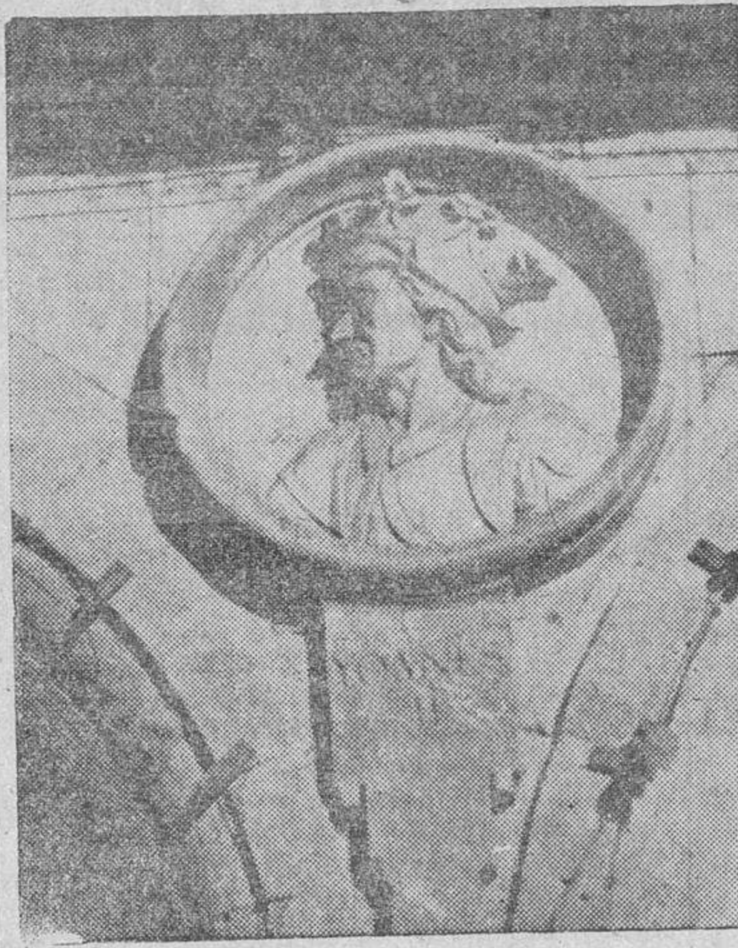
Un rey de gran relieve, es Juan II, en este busto del medallón de la plaza salmantina.

La mirada ha de ascender mucho para alcanzar la leyenda de Fernando III el Santo, "retornado en tamaño ampliación" y con el aditamento de una espada férrea, y descendiendo nuevamente al nivel ordinario, seguimos la in-