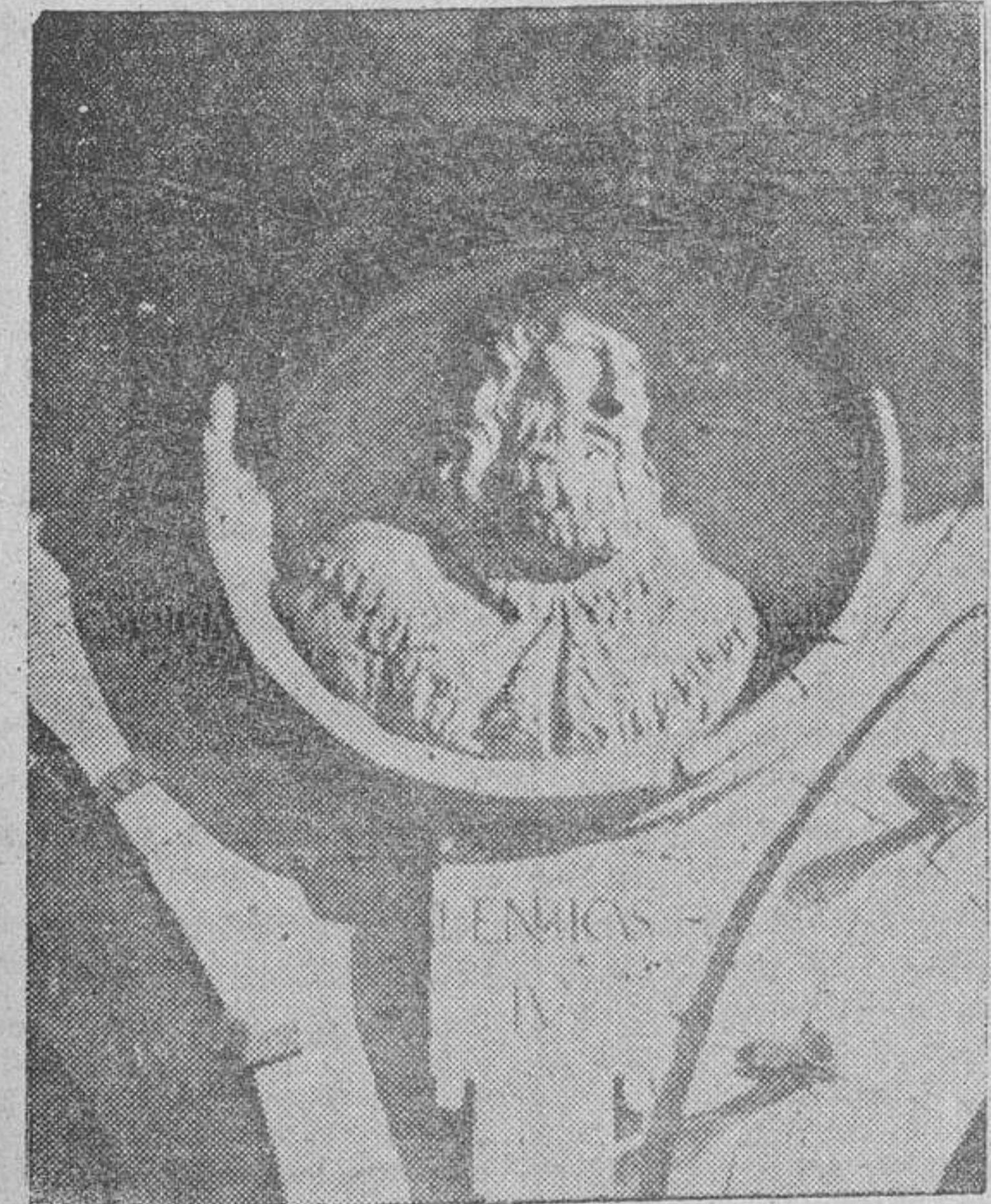
Enrique IV, uno de los bustos mejor logrados de los que adornan los arcos de nuestra Plaza

POZO AMARILLO, 2 TELEFONO 1372 CAMBIO DE CARTILAS LOS DIAS 14, 15 Y 16 Ofrece su establecimiento a sus amigos y público en general :: SERVICIO A DOMICILIO