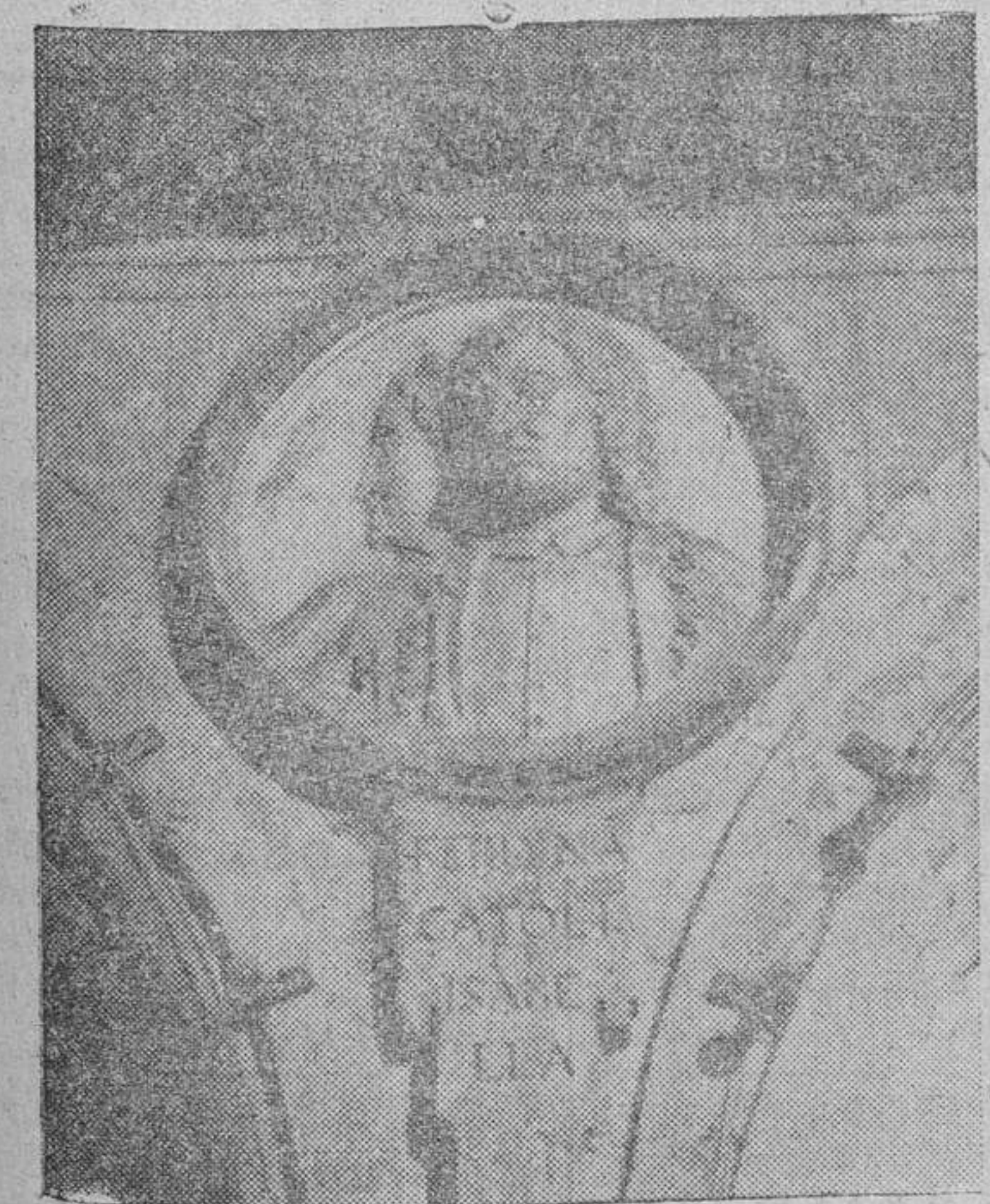
El artista aquí estuvo desafortunado; más que Fernando e Isabel, compuso los bustos de dos hermanos siameses.