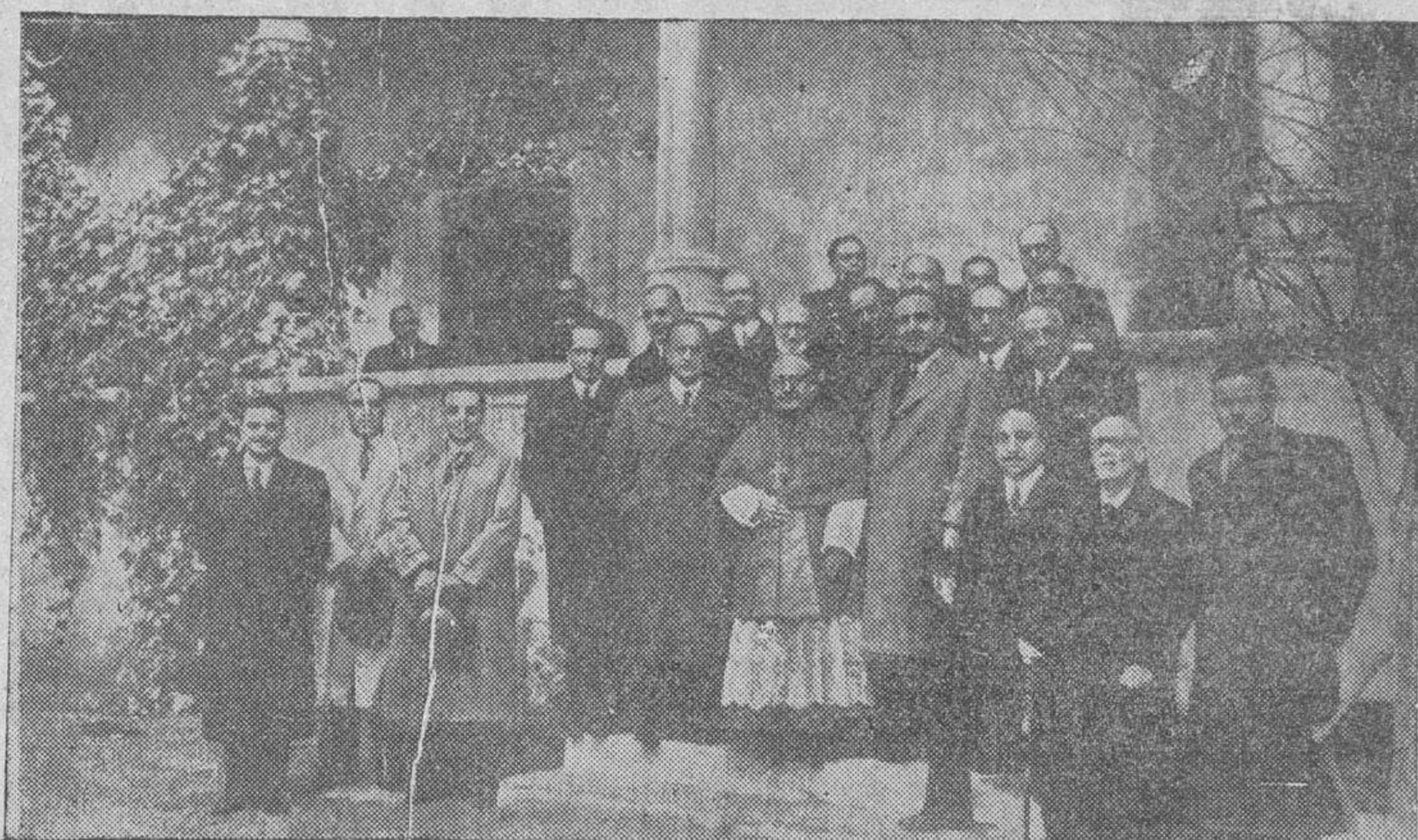
El Cardenal Primado, el ministro de Justicia, autoridades y representaciones, en el acto de inauguración de un colegio-reformatorio para jóvenes descarriadas, dirigido por religiosas adoradoras y construido por la Junta provincial de Protección a la Mujer